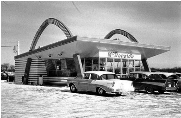
Новый ресторан Макдональдс