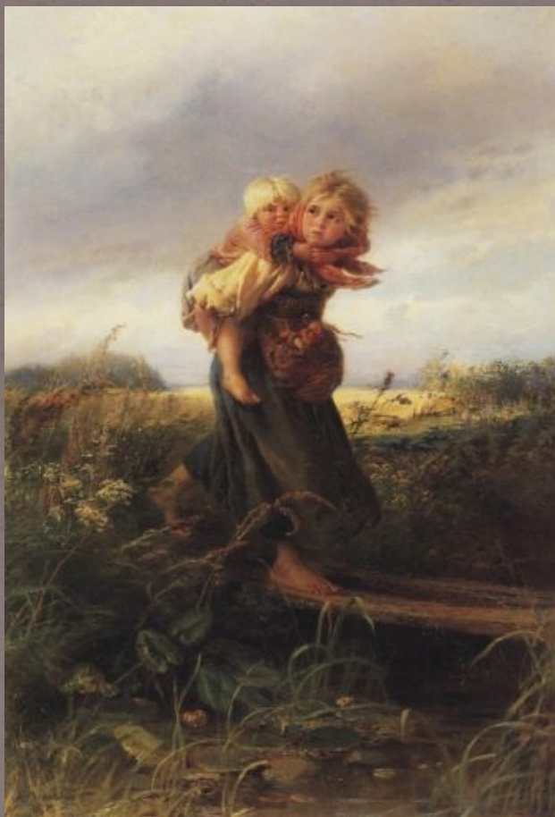
Дети, бегущие от грозы, 1872 г.