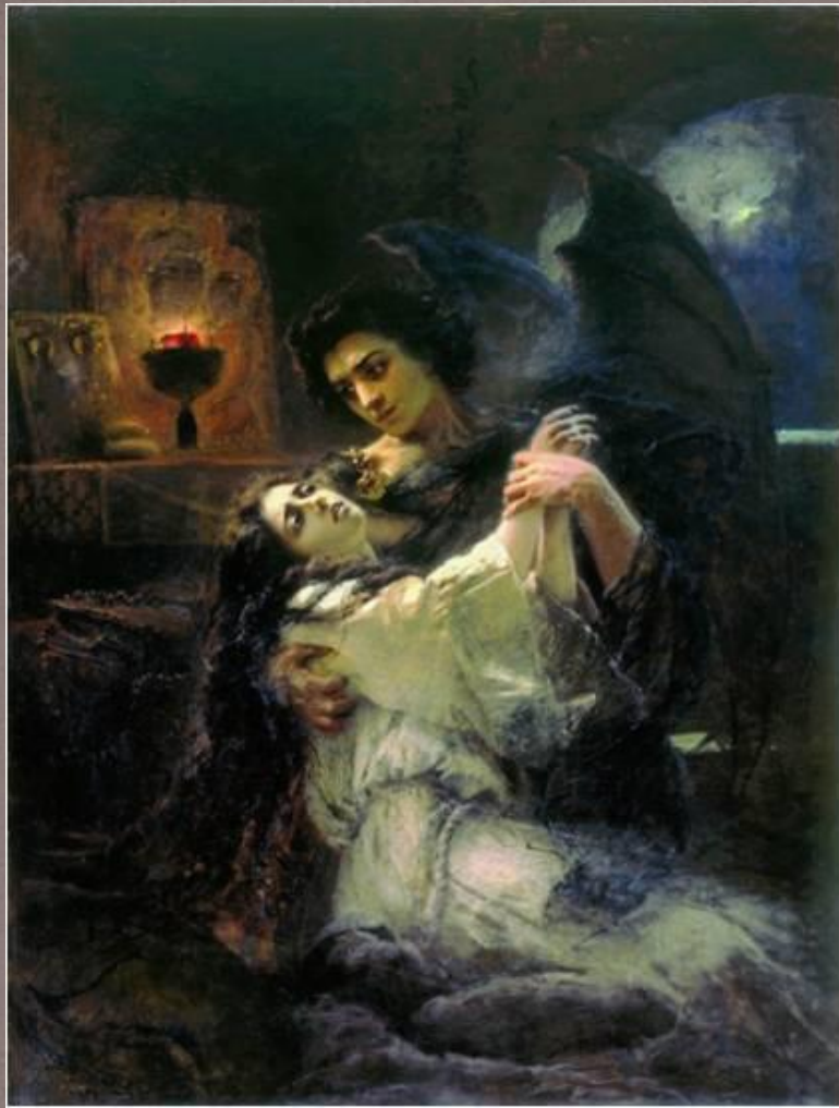
«Демон и Тамара» 1889