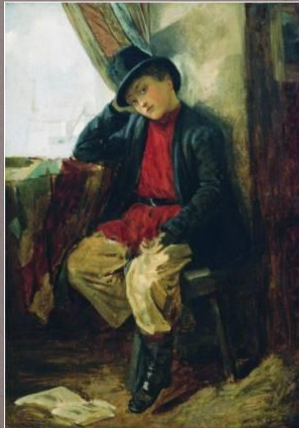
Портрет Владимира Егоровича Маковского в детстве, 1854 г.

Константин Егорович родился в Москве, в семье одного из организаторов Московского училища живописи ваяния и зодчества Е. И. Маковского