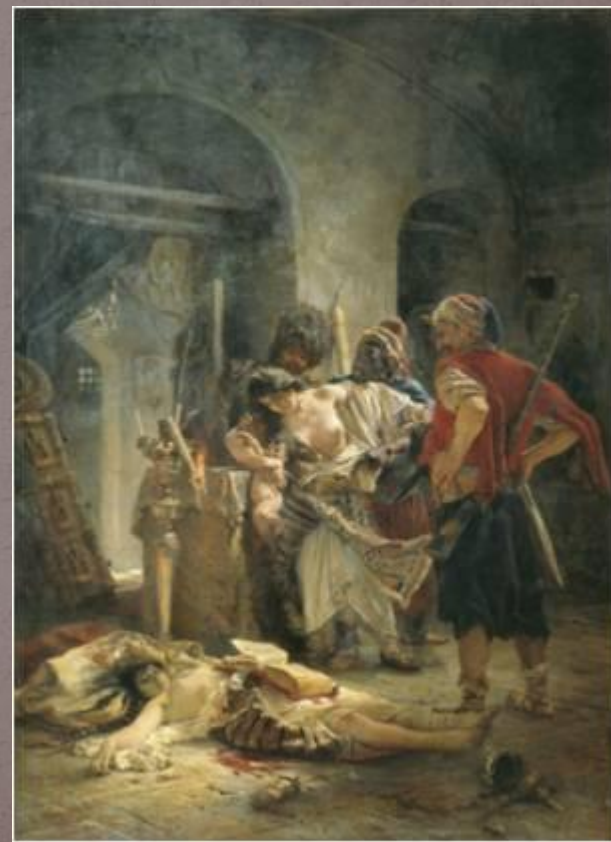
Болгарские мученицы. 1877. Маковский Константин

Получил академическую золотую медаль за мелодраматическую картину Агенты Дмитрия Самозванца убивают Бориса Годунова (1862), решенную всецело в русле романтического историзма. Написал немало сентиментальных типажей и сценок из «народного быта», в том числе популярных Детей, бегущих от грозы (1872) и трогательный образ старого слуги Алексеича (1882).