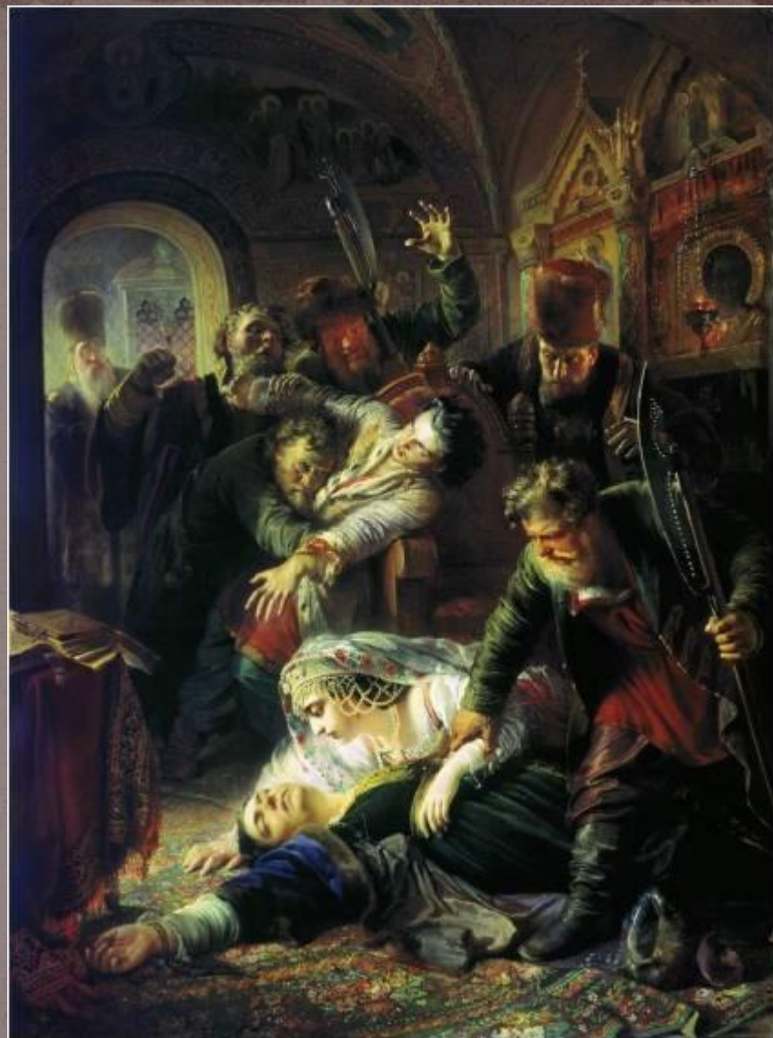
«Агенты Дмитрия Самозванца убивают Бориса Годунова» (1862)

В 1863 году Маковский, вместе с 13 другими студентами, выбранными для участия в конкурсе на Большую золотую медаль Академии, отказался писать картину на тему Скандинавской мифологии и покинул Академию, не получив диплом.