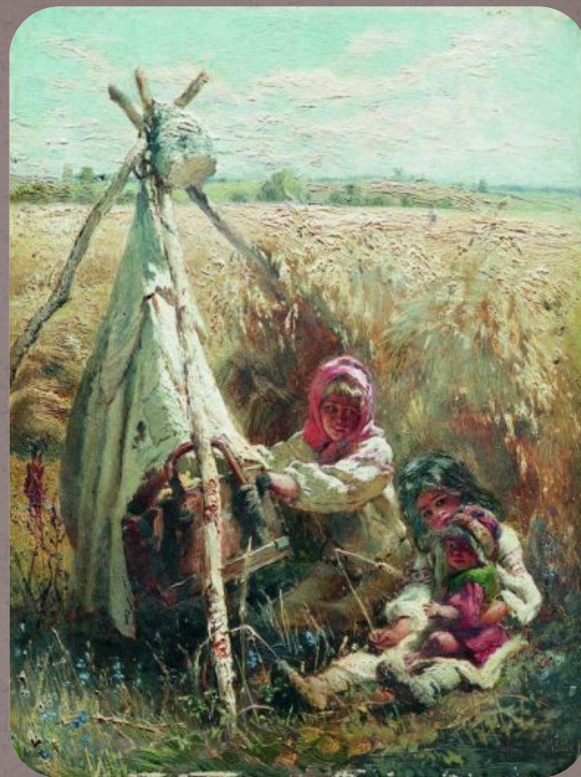
Дети в поле, 1870-е г.