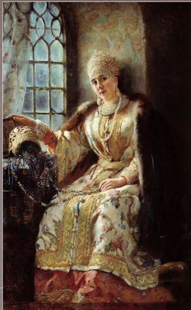
Боярыня у окна. 1885