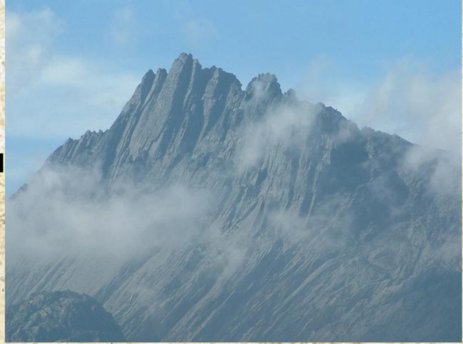
Гора Джая в Западной Новой Гвинее (Индонезия) — высочайшая точка Океании.

В прошлом острова Океании представляли собой единую сушу , однако в результате поднятия уровня Мирового океана значительная часть поверхности оказалась под водой. Рельеф этих островов гористый и сильно расчленённый. Например, высочайшие горы Океании, в том числе, гора Джая (5029 м), расположены на острове Новая Гвинея.