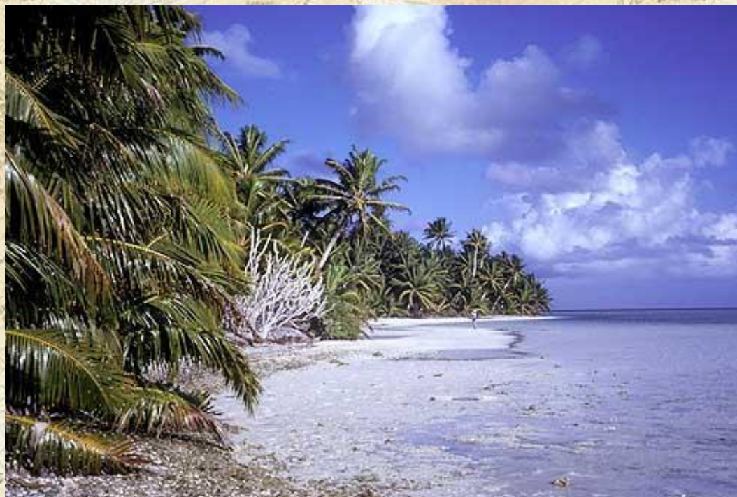
Побережье атолла Каролайн (острова Лайн, Кирибати)

Океания расположена в пределах нескольких климатических поясов: экваториального, субэкваториального, тропического, субтропического, умеренного. На большей части островов преобладает тропический климат .