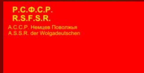
Флаг АССР НП в 1937—1941 годах