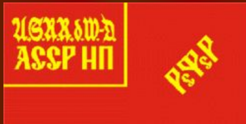
Флаг АССР НП в 1924—1937 годах

Главным органом государственной власти АССР НП являлся Центральный исполнительный комитет Советов АССР Немцев Поволжья (с 1937 года — Верховный Совет АССР Немцев Поволжья), являвшийся законодательным (представительным) органом, формируемый с 1937 года на основе всеобщих выборов. На постоянной основе работали Президиум ЦИК АССР НП (с 1937 года — Президиум Верховного Совета АССР НП), остальные члены ЦИК (с 1937 — депутаты Верховного Совета) собирались на сессии 10—12 раз в год.