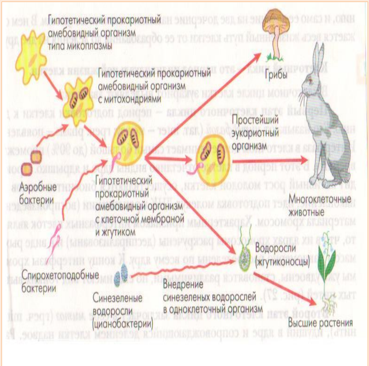
Схема возможного возникновения эукариот из прокариот.