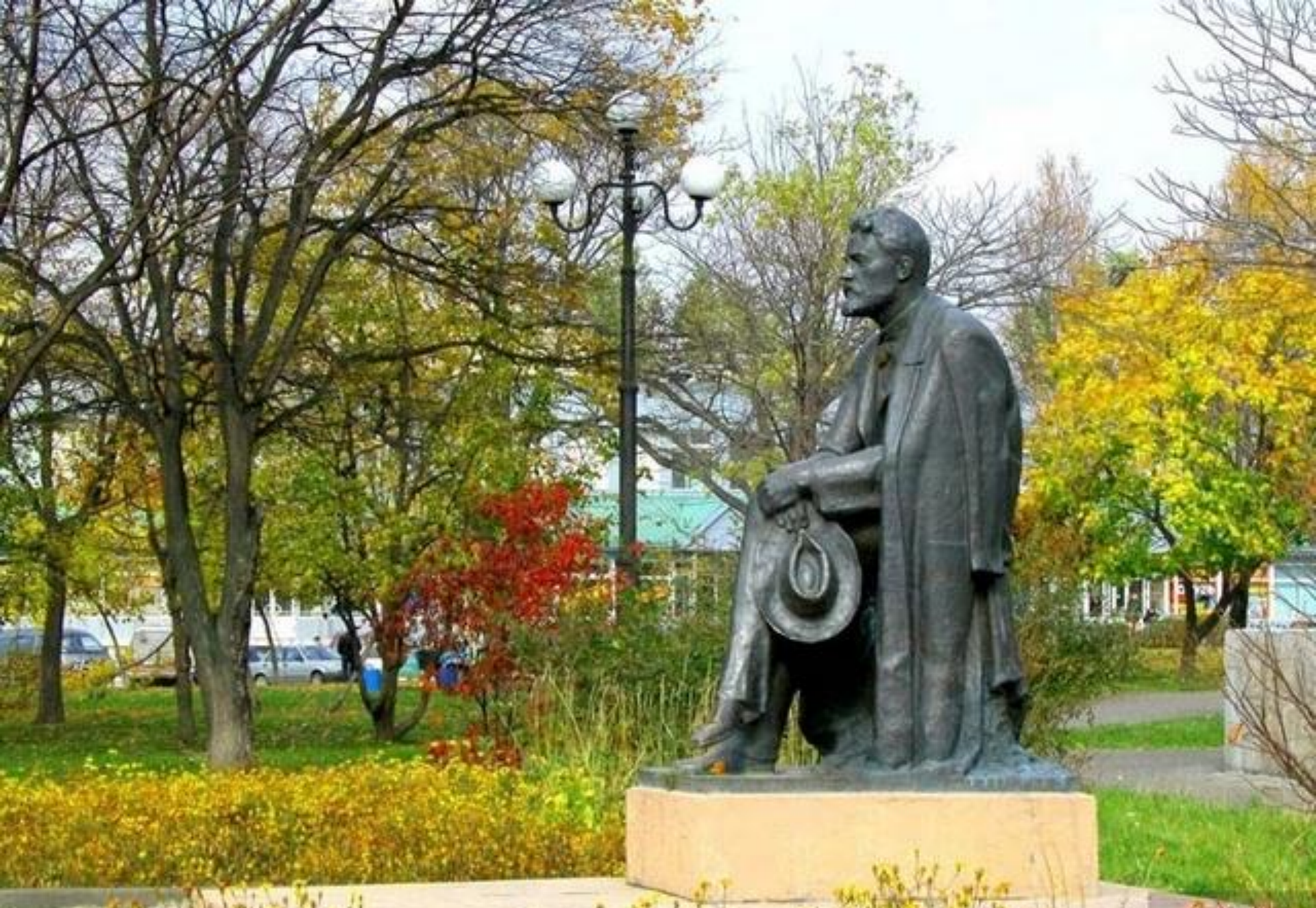
ПАМЯТНИК ЧЕХОВУ НА САХАЛИНЕ