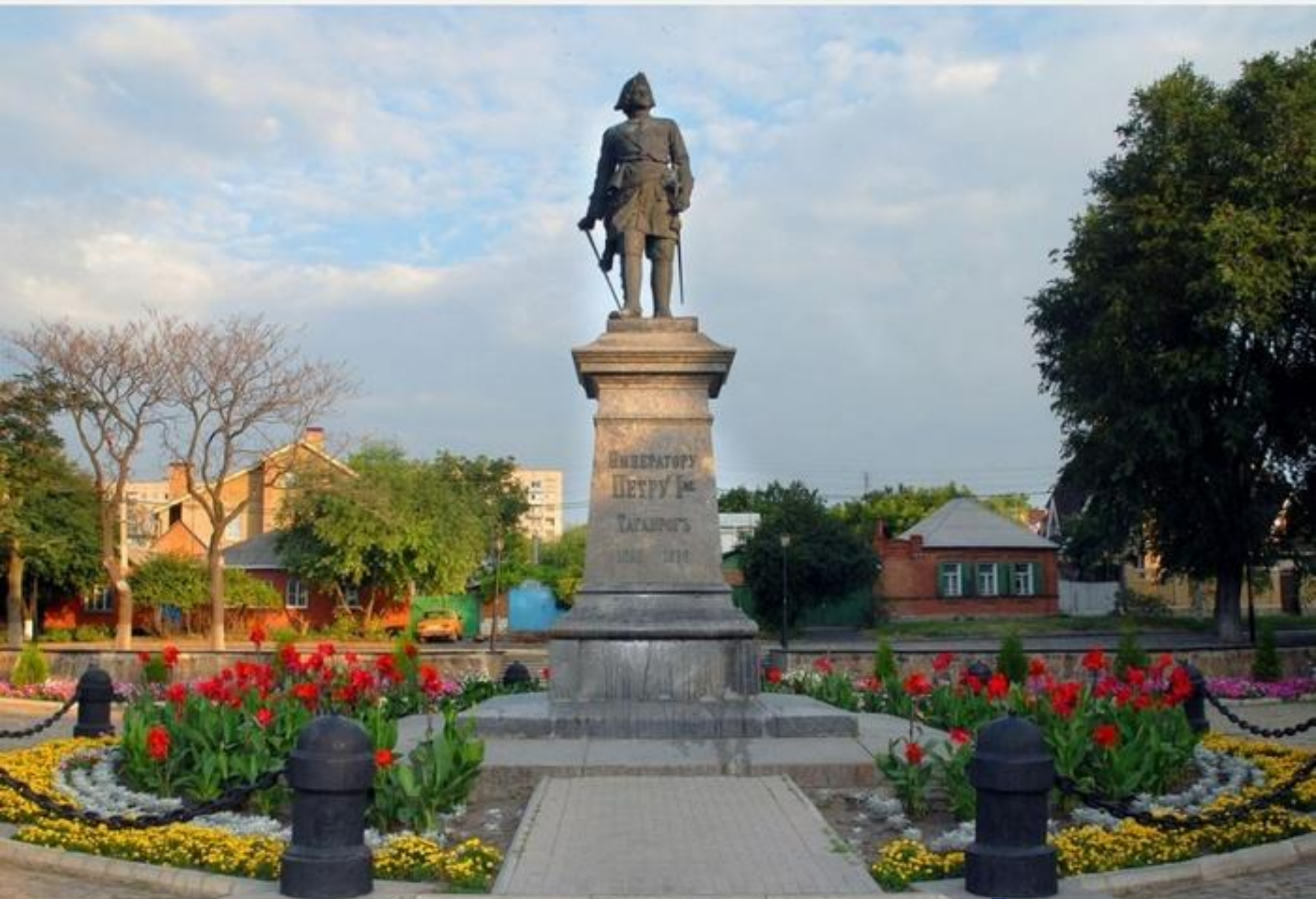
Скульптор М.М. Антокольский «Петр I».