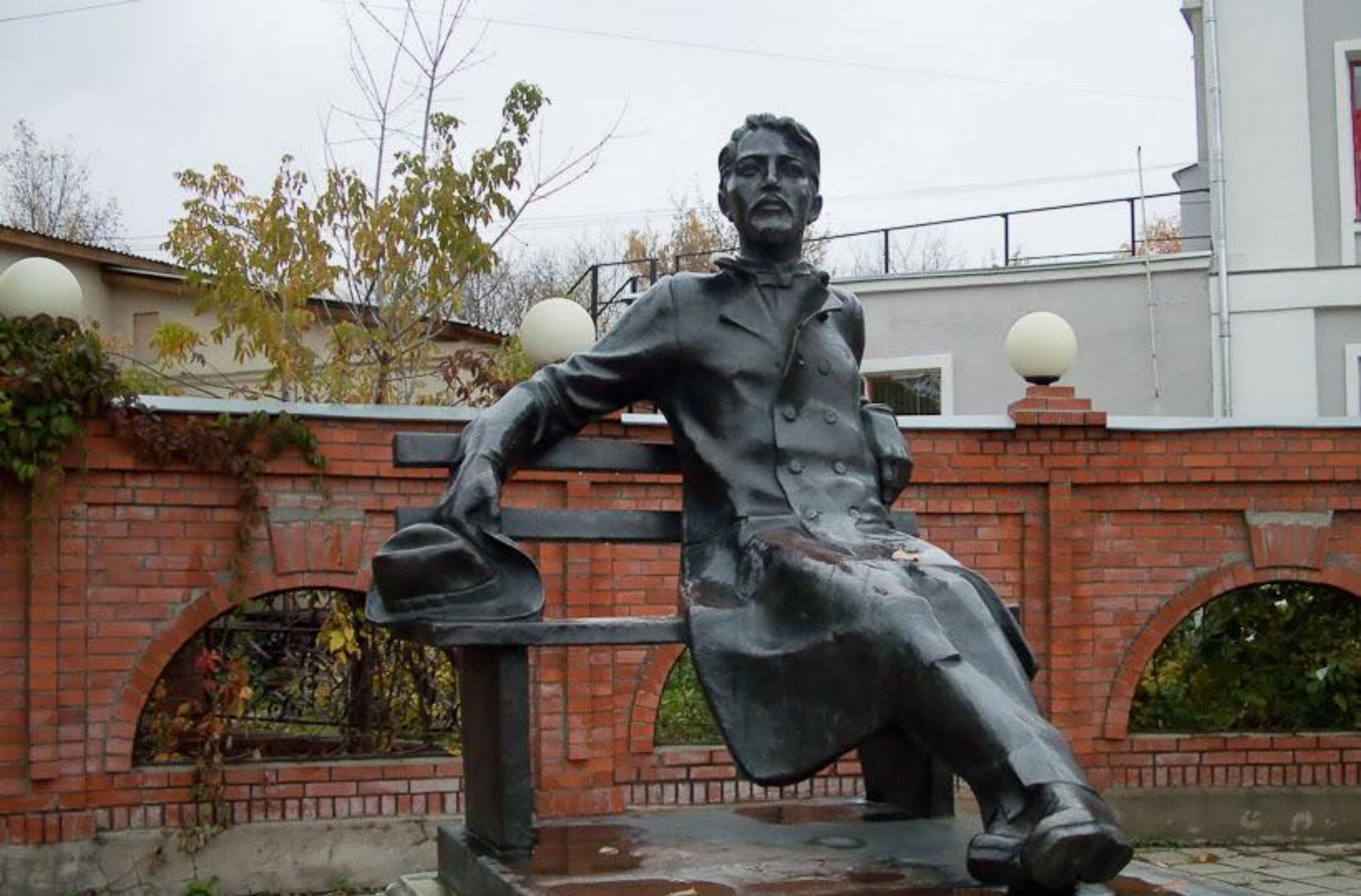
Памятник Чехову в Серпухове