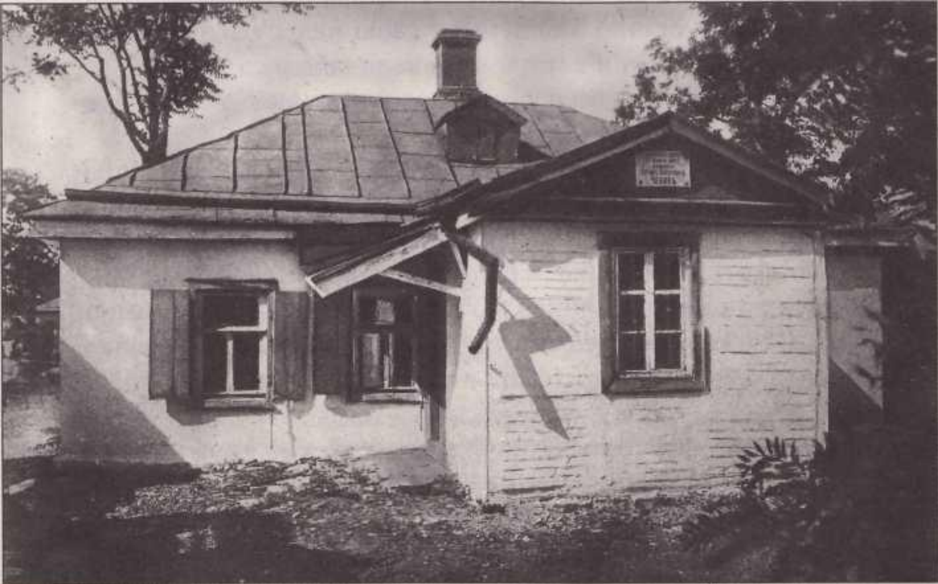
Дом, где родился Чехов