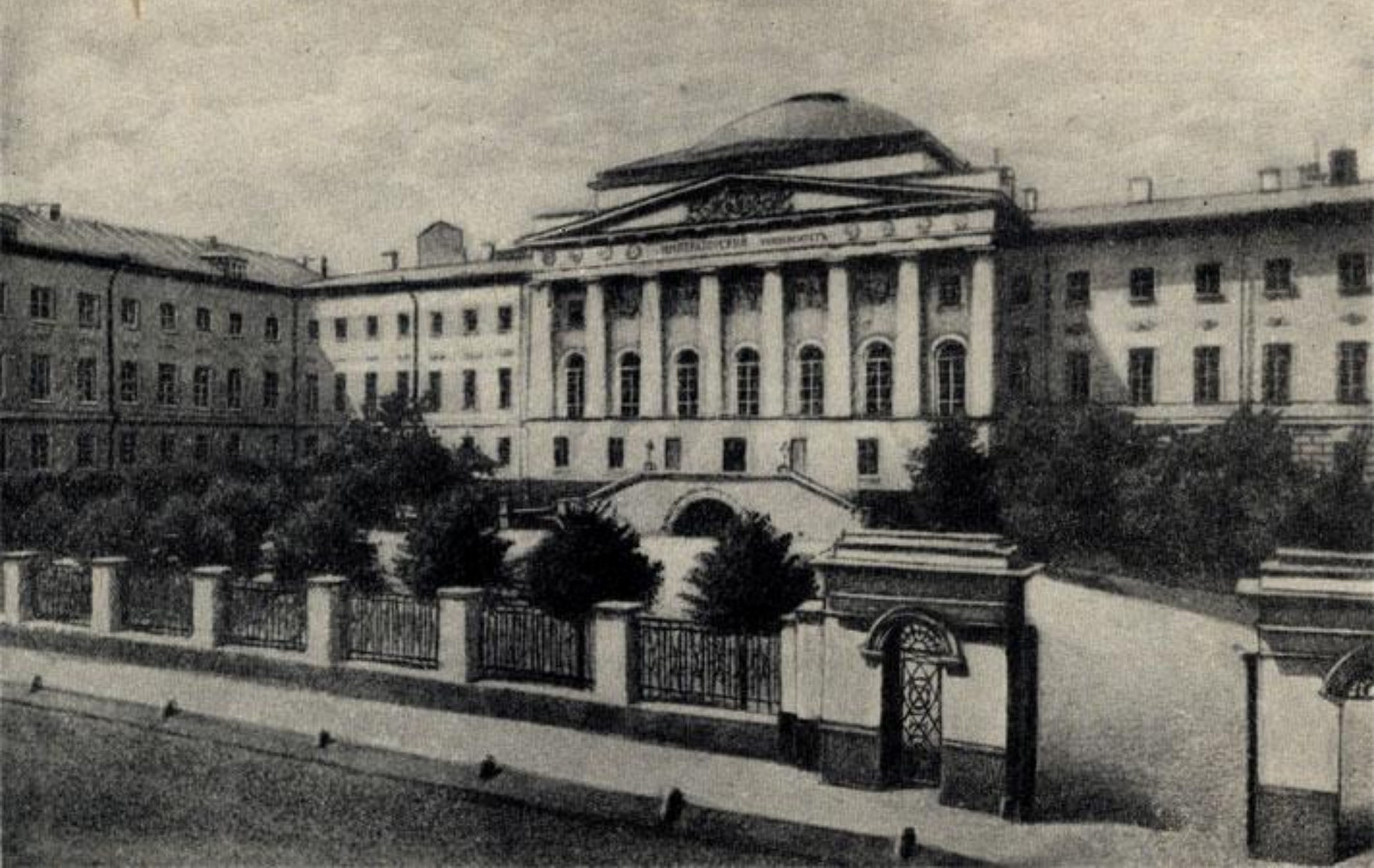
Московский медицинский университет