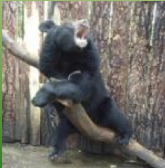
Гималайский медведь Кузьма