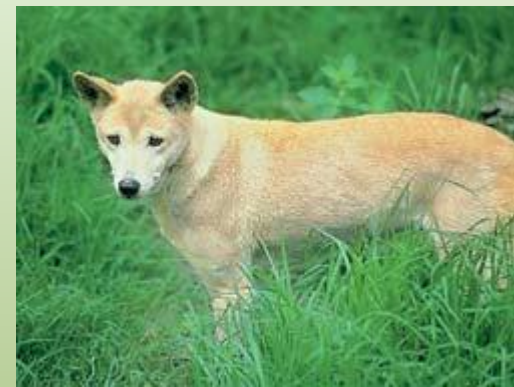
Дикая собака динго.