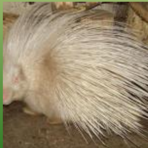
Индийский дикобраз - альбинос.