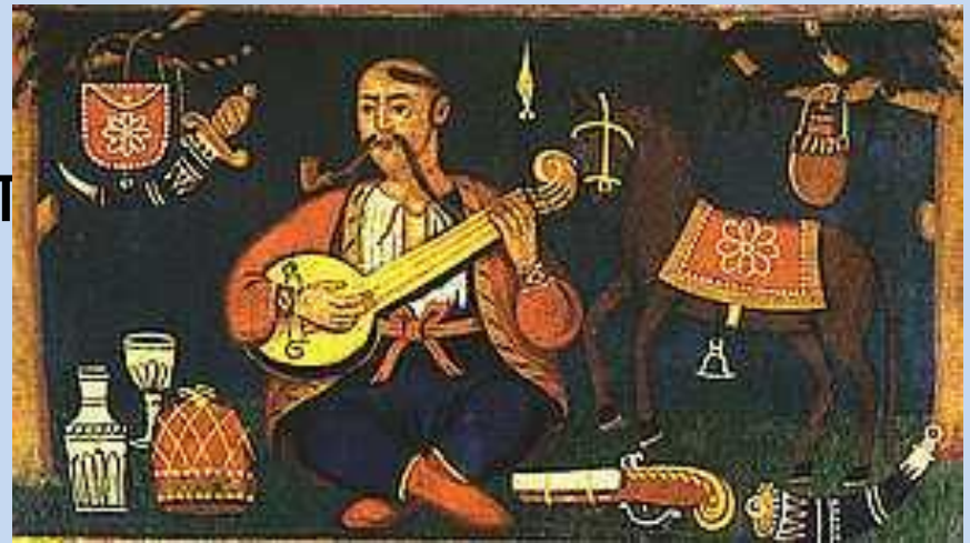
Козак Мамай Козак Мамай с бандурой — символ музыкальности украинского народа

Украинская музыка берёт начало со времён Киевской Руси берёт начало со времён Киевской Руси и в своём развитии охватывает практически все типы музыкального искусства . Сегодня разнообразная украинская музыка звучит на Украине и далеко за её пределами, развивается в народной и профессиональной