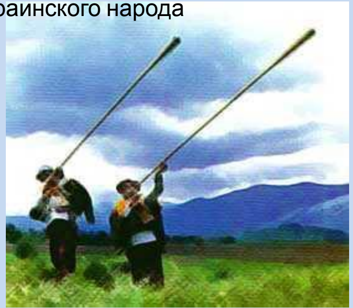
Исполнители на трембитах