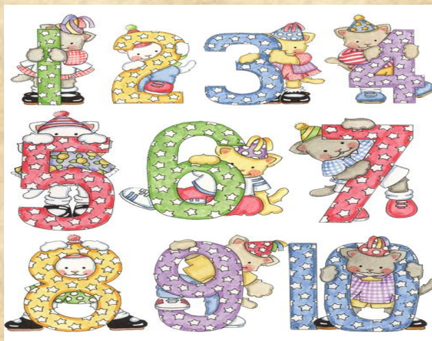
Проект «Числа в загадках, пословицах и поговорках.»