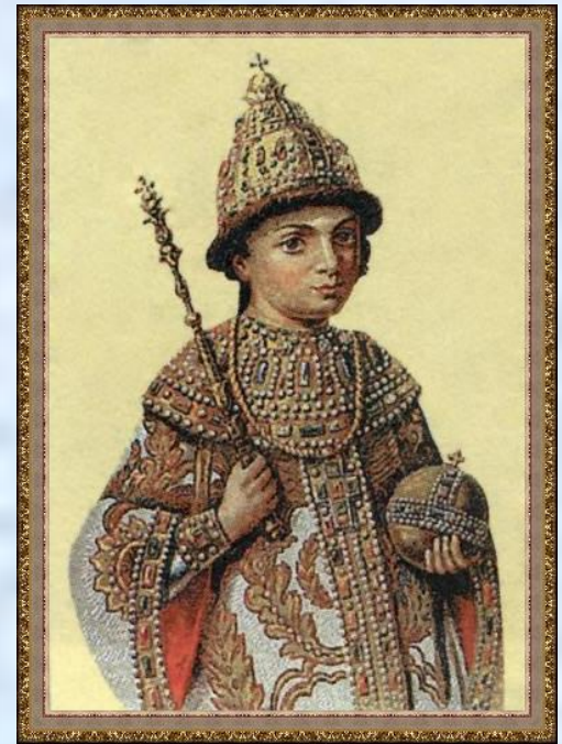
Петр I Алексеевич