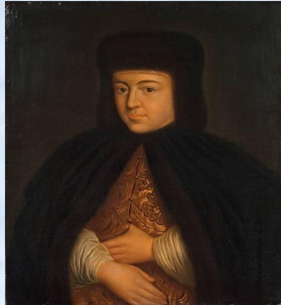
Наталья Кирилловна Нарышкина, мать Петра