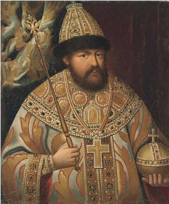
Алексей Михайлович, русский царь, отец Петра

Петр был младшим сыном царя Алексея Михайловича. Царь Алексей был женат два раза. От первого брака у него было 13 детей. Многие из них умерли ещё при жизни отца, и из сыновей только Федор и Иван его пережили, хотя и были оба серьезно болезненными. Царь был очень рад рождению сына.