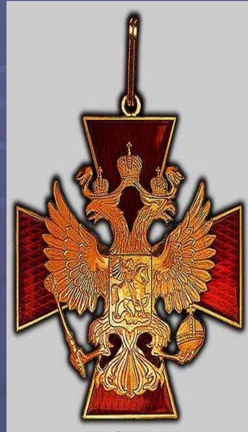
Орден "За заслуги перед Отечеством"