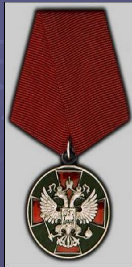
Медаль "За Отвагу"