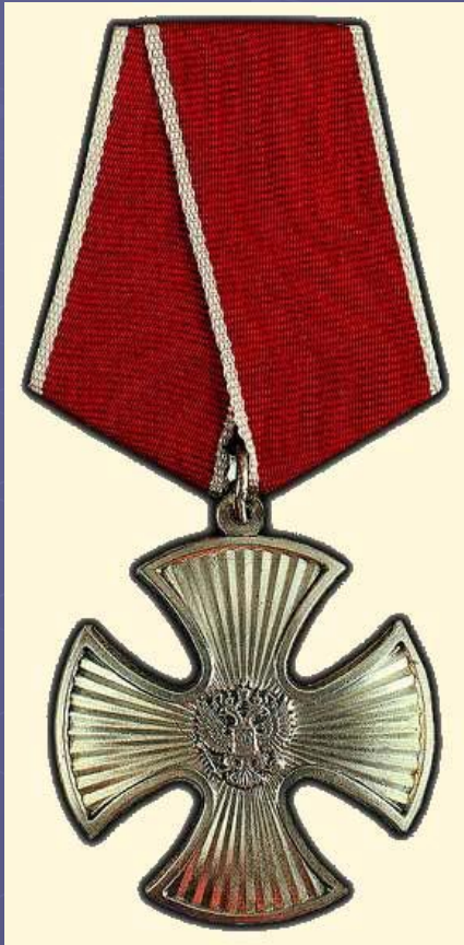
Орден "За Мужество"