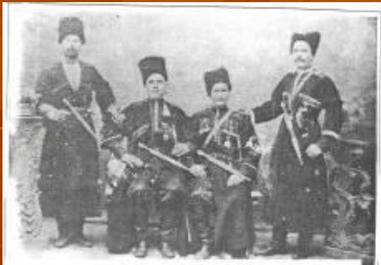
Наши земляки, казаки 4-го кавказского полка.

Датой основания станицы принято считать прибытие к редуту Екатеринославских казаков - 8 октября 1802 года.