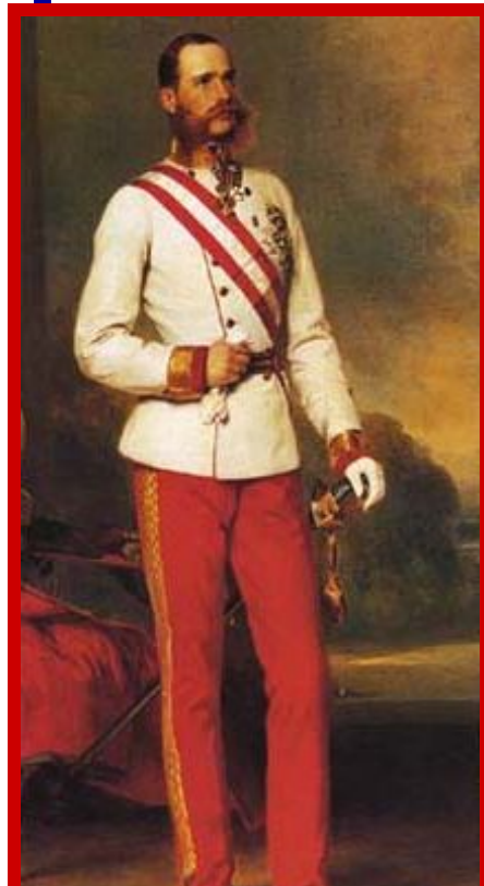
Император Австро- Венгрии Франц Иосиф

1867 г. - подписано соглашение о преобразовании империи Габсбургов в двуединую монархию, состоявшую из независимых друг от друга во внутренних делах государств — Австрии и Венгрии.