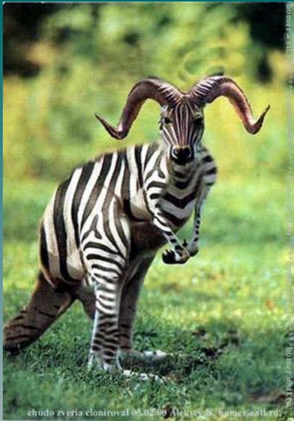
chudo zveria cloniroval 03.07.08 Aleksey N. Gumenastil.ru