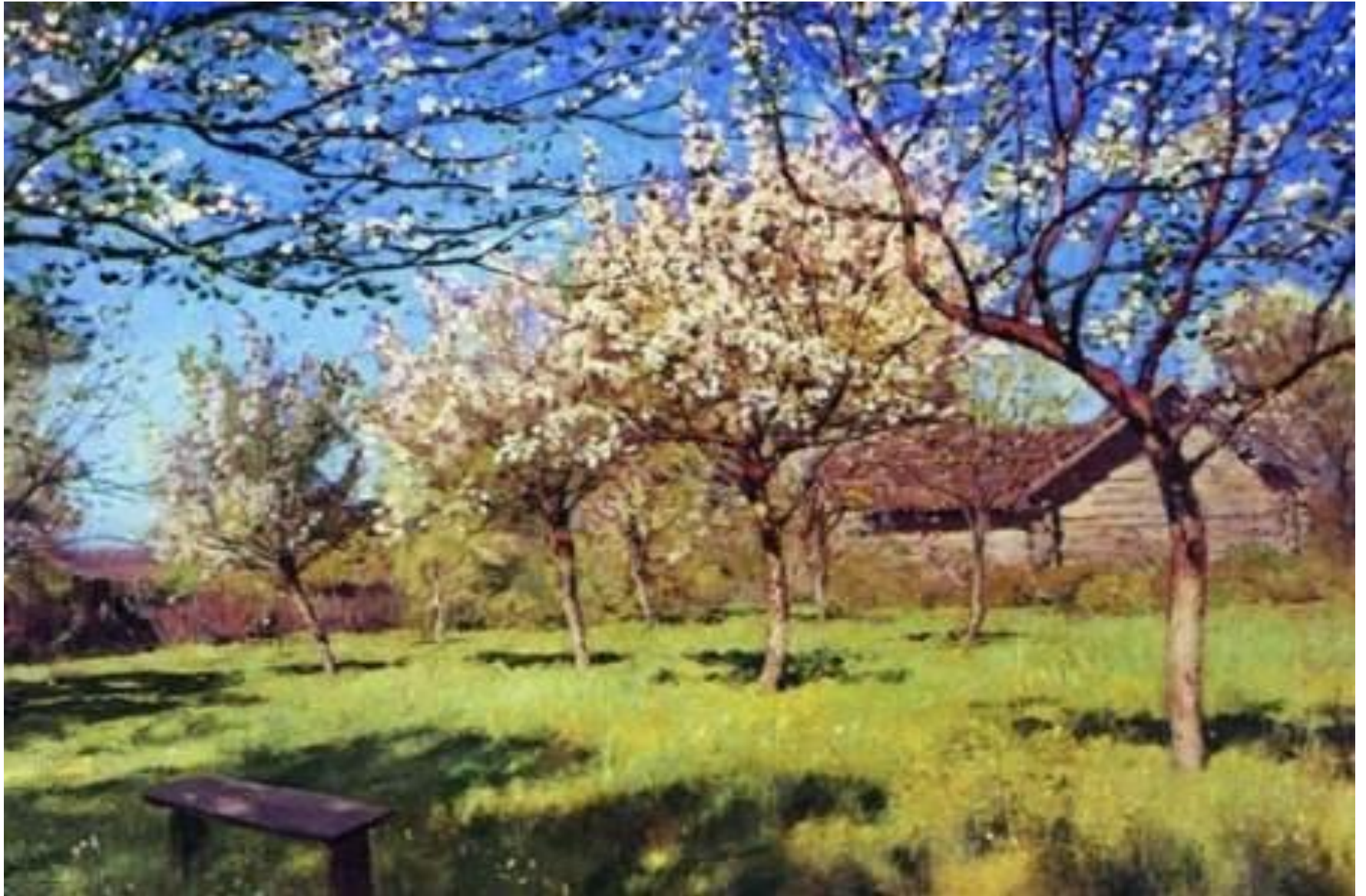
И.И.ЛЕВИТАН «ЯБЛОНИ ЦВЕТУТ»