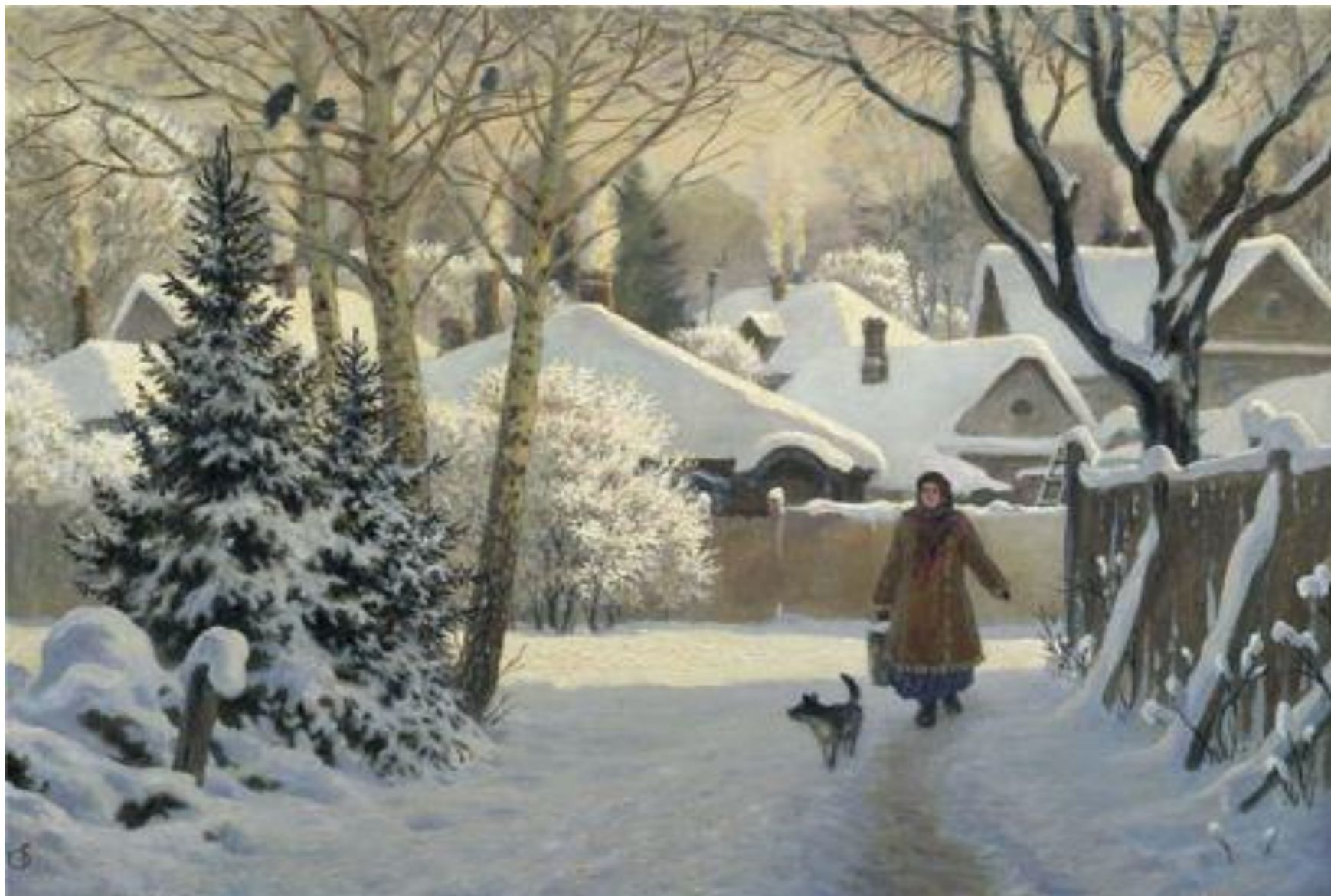
КУИНДЖИ А.И. «ЗИМНИЙ ДЕНЬ»