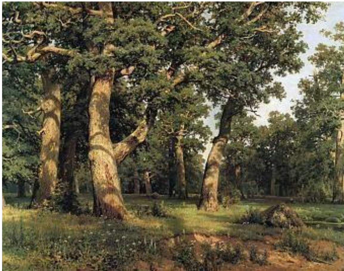
И.И. ШИШКИН «ДУБОВАЯ РОЩА»