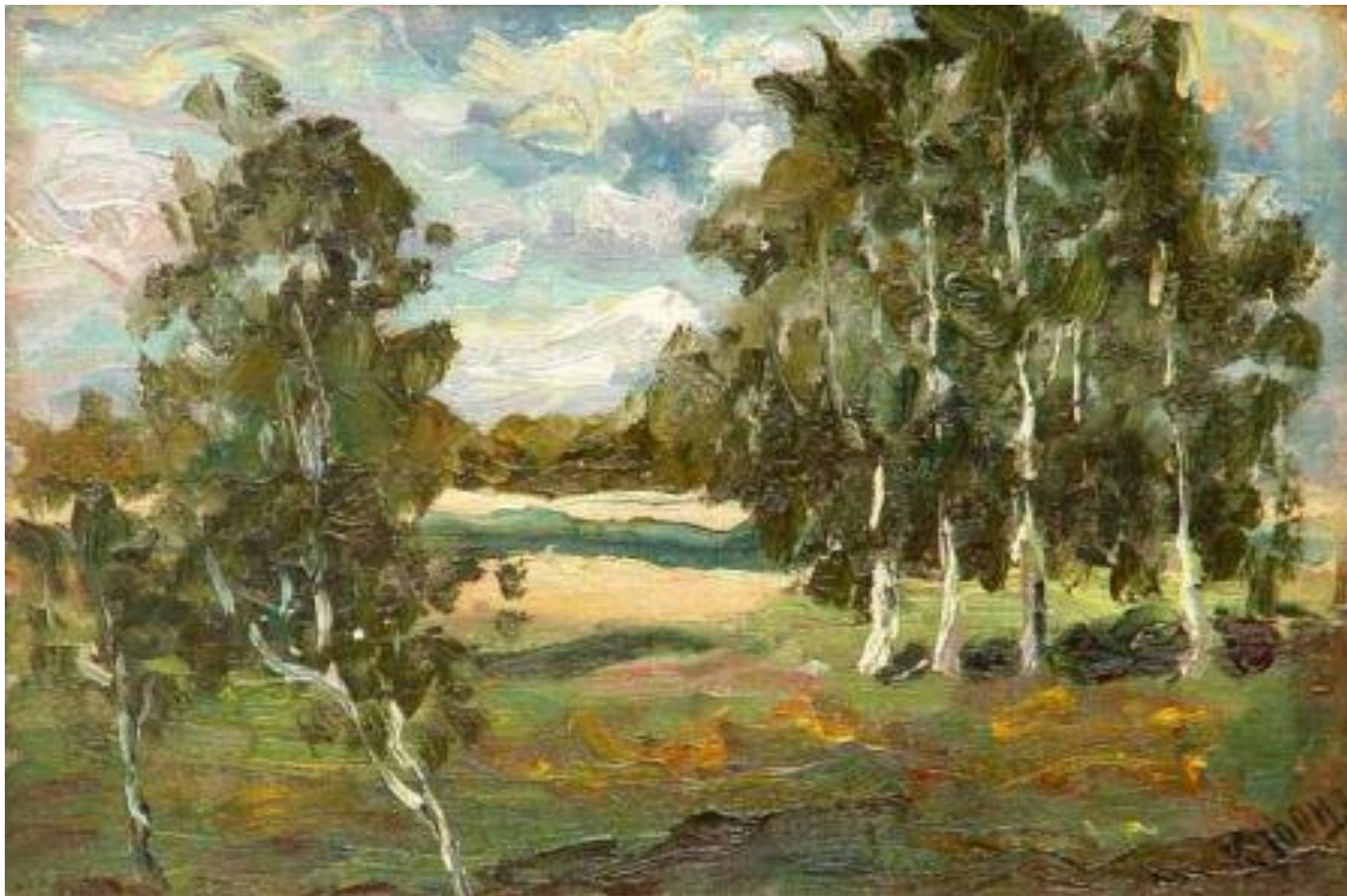
ЮОН К.Ф. «ПЕЙЗАЖ С БЕРЕЗАМИ»