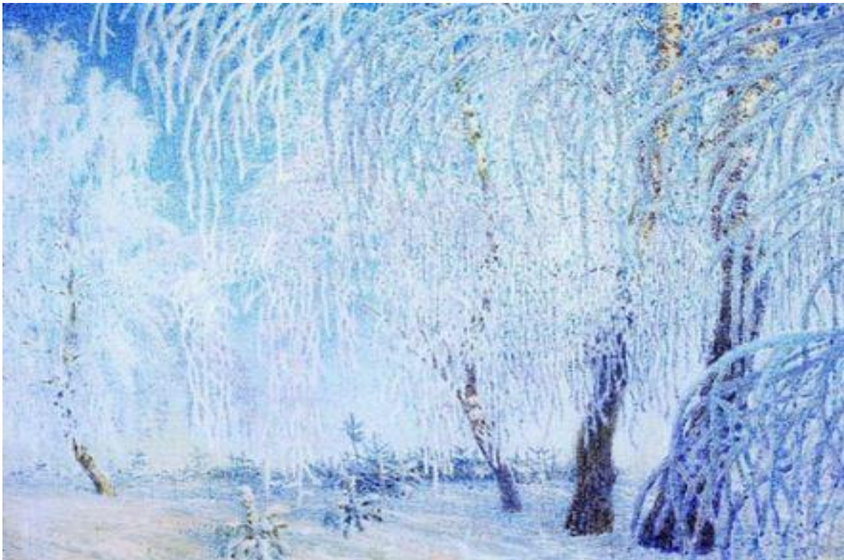
ГРАБАРЬ И. «ИНЕЙ»