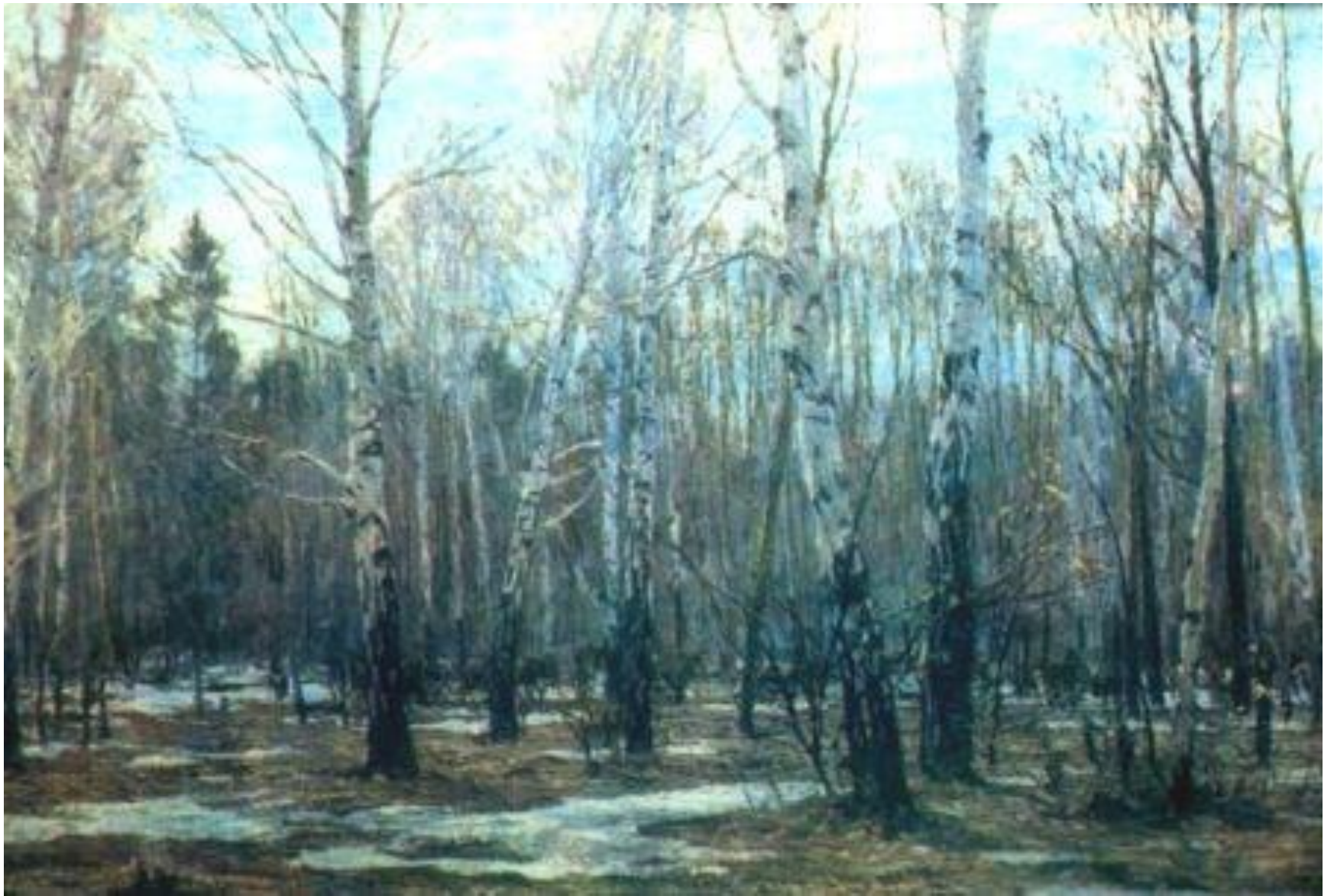
ГРИЦАЙ А. «АПРЕЛЬ В ЛЕСУ»