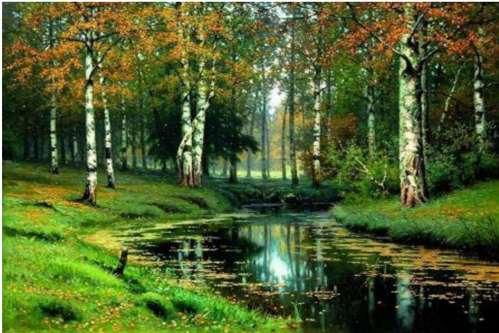
ВОЛКОВ Е.Е. «ЗОЛОТАЯ ОСЕНЬ. ТИХАЯ РЕЧКА»