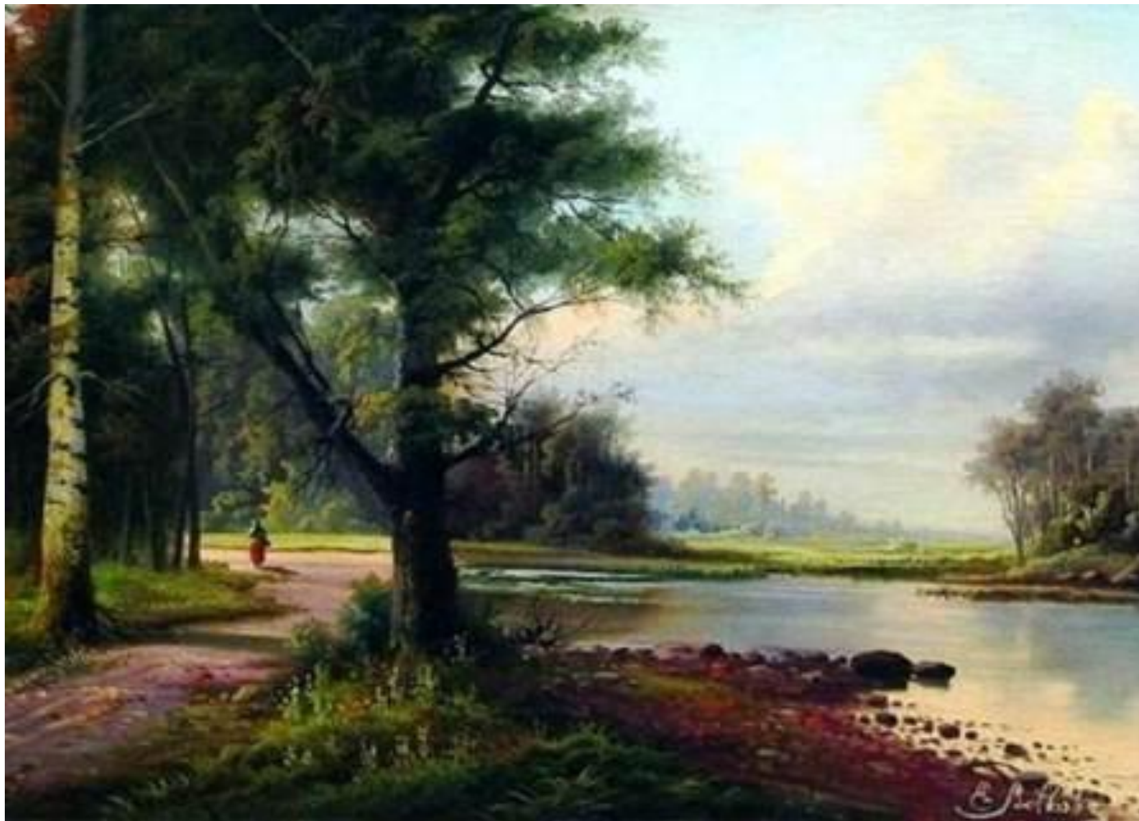
ВОЛКОВ Е.Е. «ПЕЙЗАЖ»