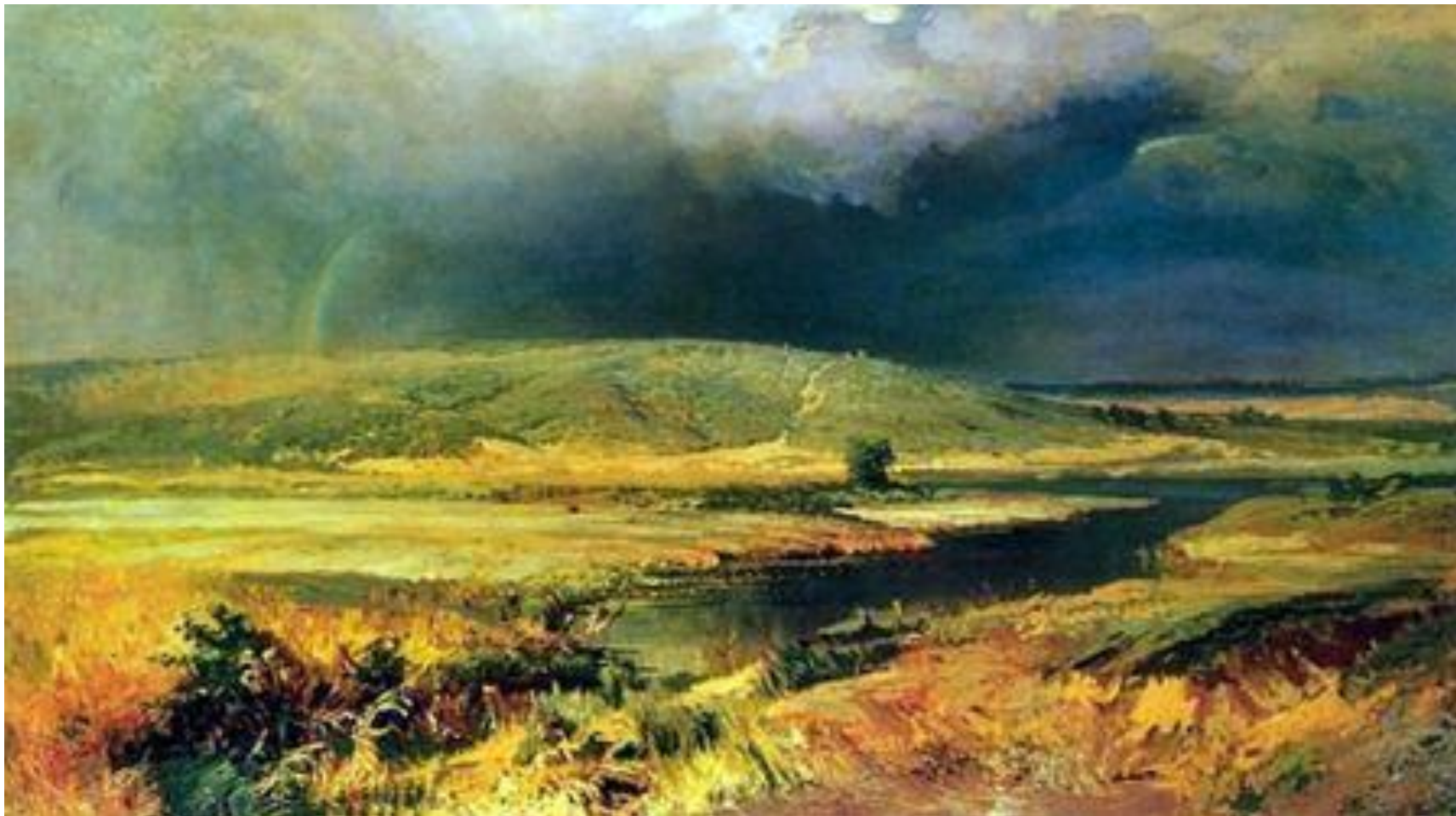
ВАСИЛЬЕВ Ф.А. « ВОЛЖСКИЕ ЛАГУНЫ »