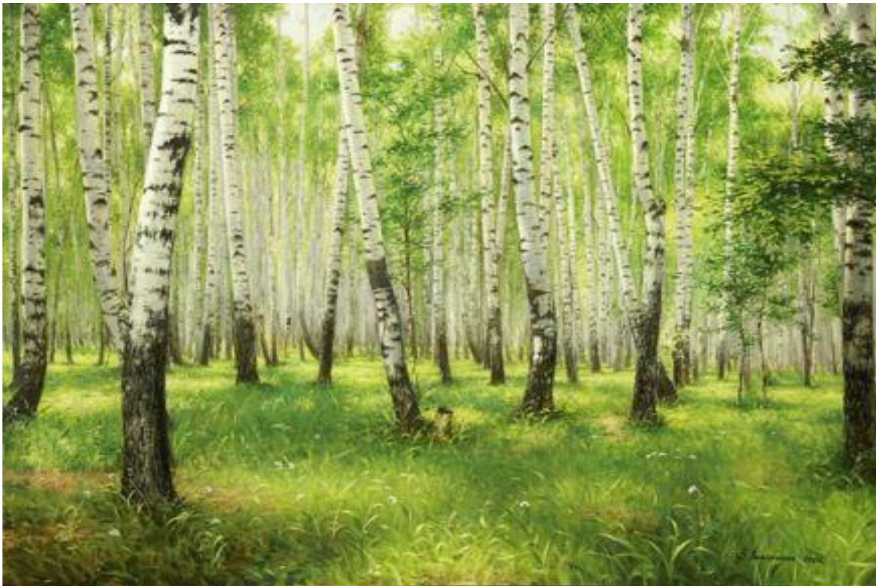
АЛЕКСАНДРОВ В.А. «БЕРЕЗОВАЯ РОЩА»