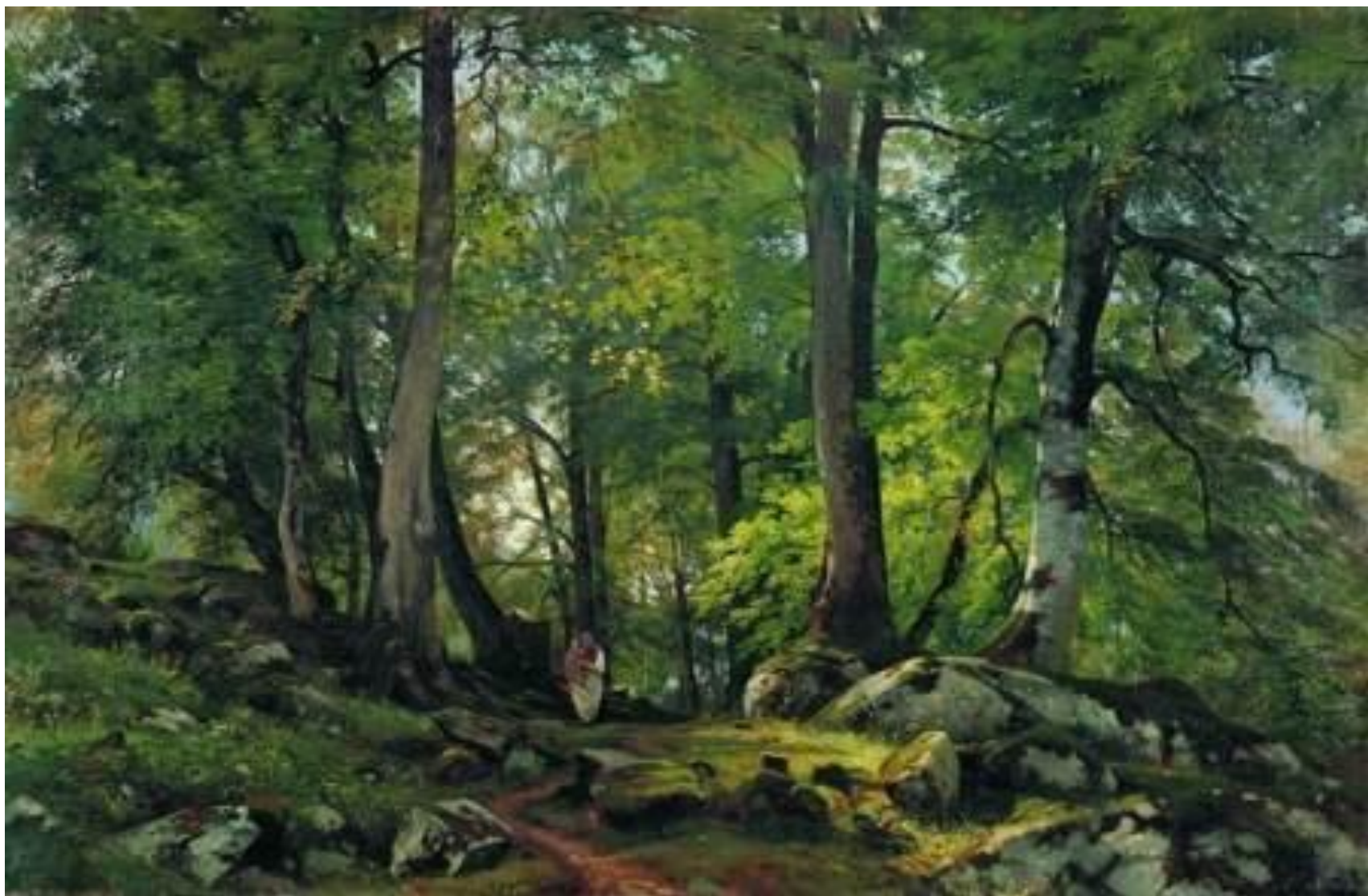
И.И. ШИШКИН «ЛЕС»