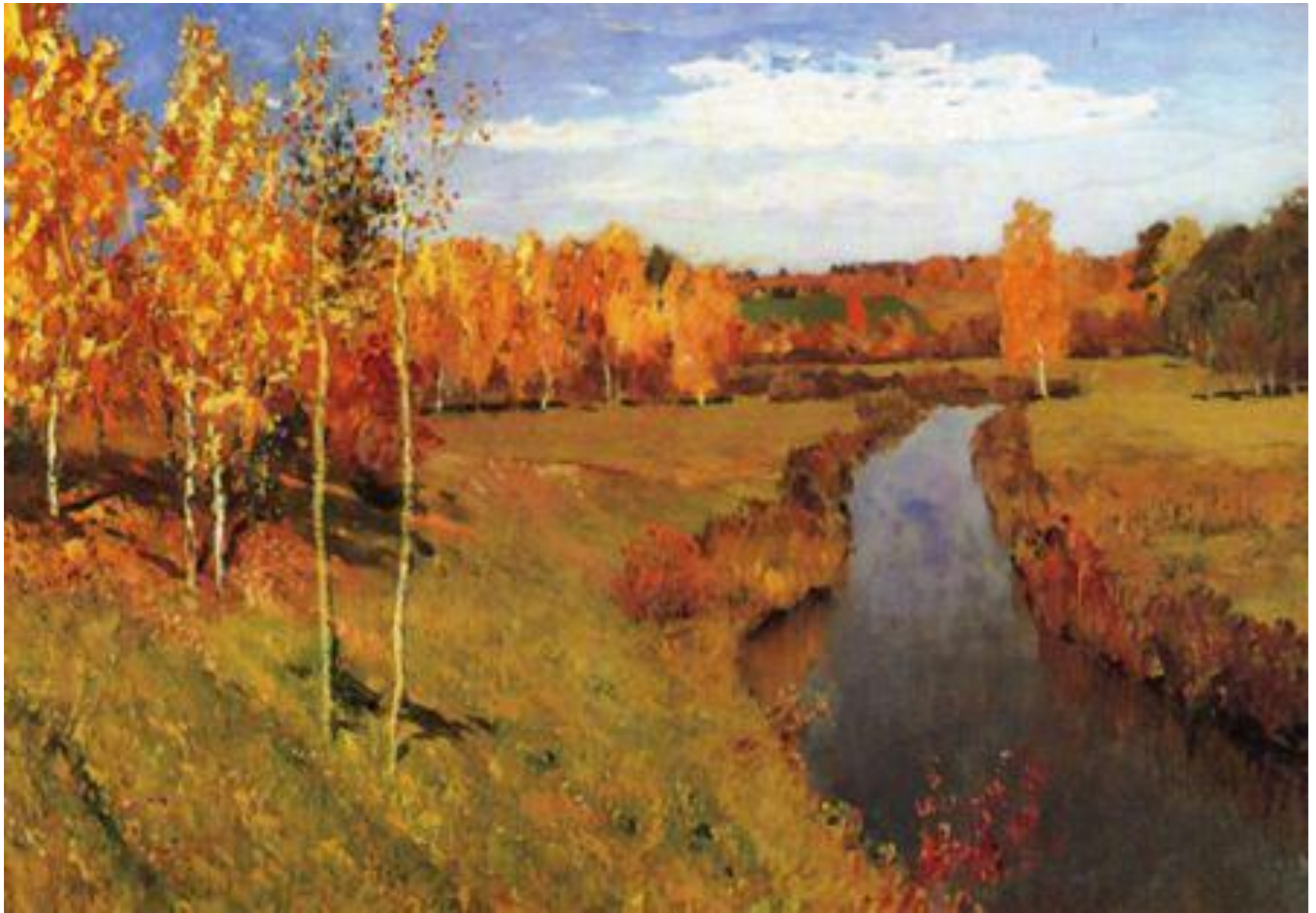
ЛЕНВИТАН И.И. «ЗОЛОТАЯ ОСЕНЬ»