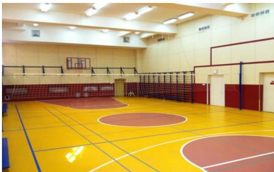
Спортивный зал 2 корпус