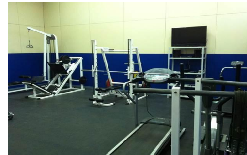
Тренажерный зал 2 корпус