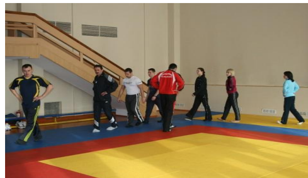
Спортивный зал общежития