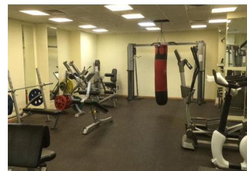
Спортивный зал 3 корпус