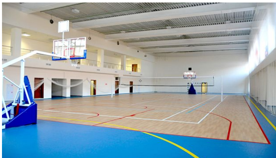
Универсальный спортивный зал