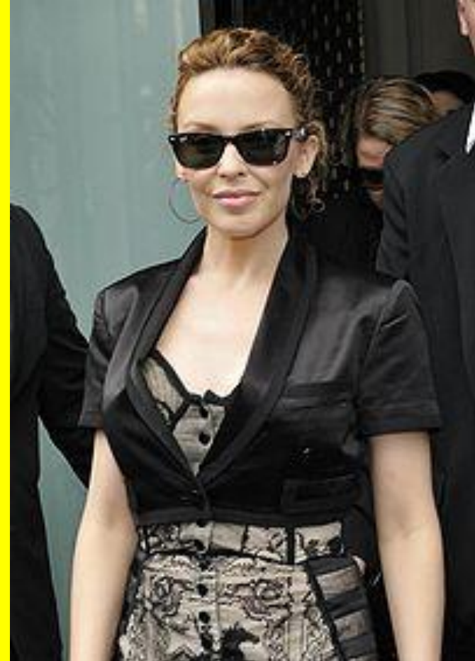
Кайли Энн Минóуг