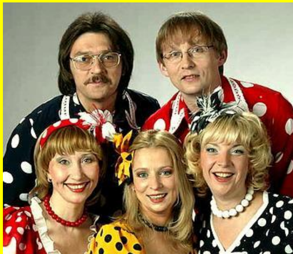
Группа Группа "Группа Чё те надо Гру ппа "Чё те надо" "Балаган