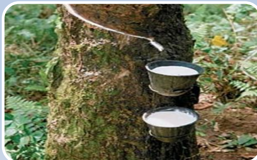
Добування каучуку з гевеї