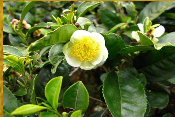
Квітка на чайному куці