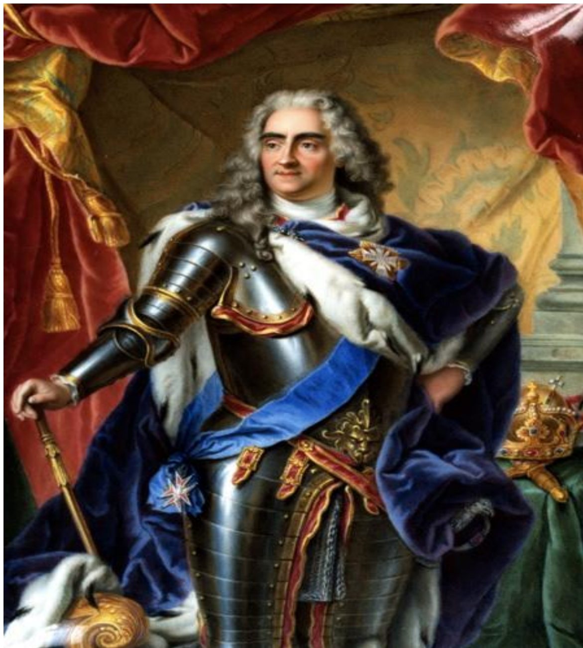
Август II (1694-1734гг) Курфюрст Саксонии.