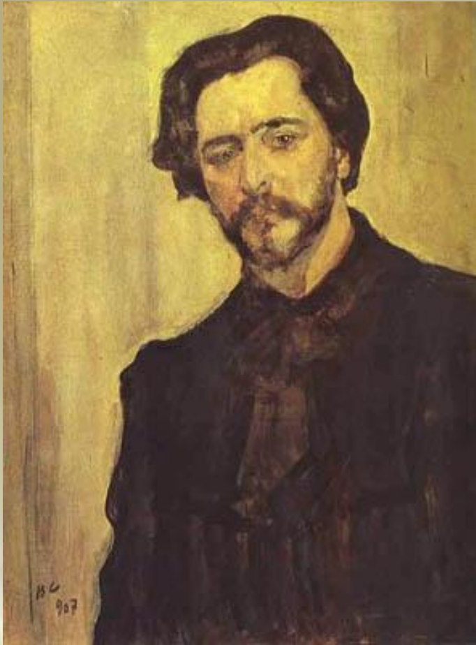
Л.Андреев. Художник Серов

Неожиданно Андреев получил предложение знакомого адвоката о месте судебного репортера в газете "Московский вестник" для написания очерков "Из залы суда".