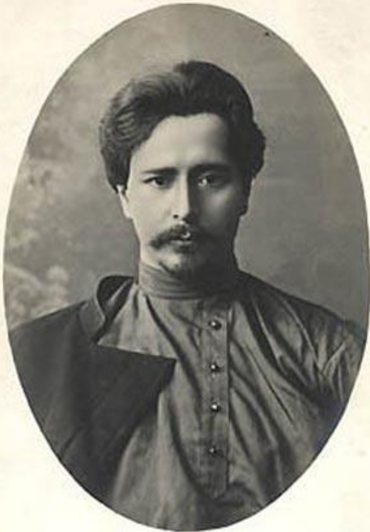
И. 1. ЛЕОНИДЪ АНДРЕЕВЪ-LEONID ANDREJEW