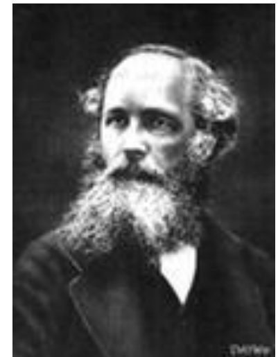
Джеймс Клерк Максвелл 23