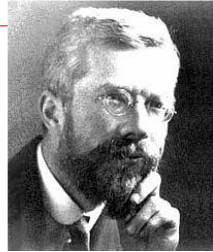
Рональд Эйлмер Фишер