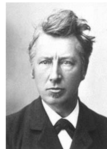
Якоб Хендрик Вант-Гофф