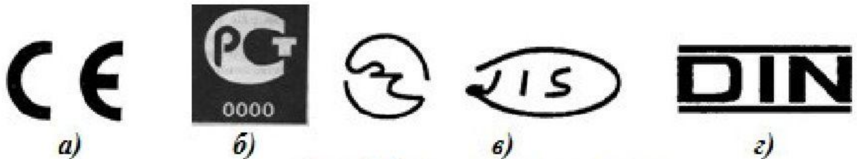
Рис. 3. Знаки соответствия: