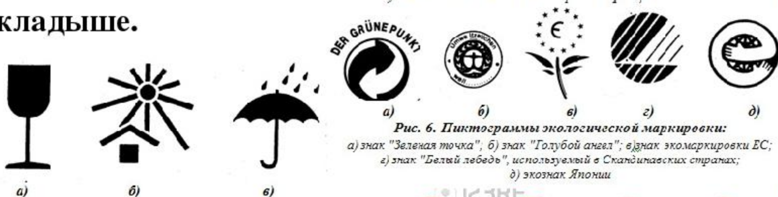
Рис. 6. Пиктограммы экологической маркировки: