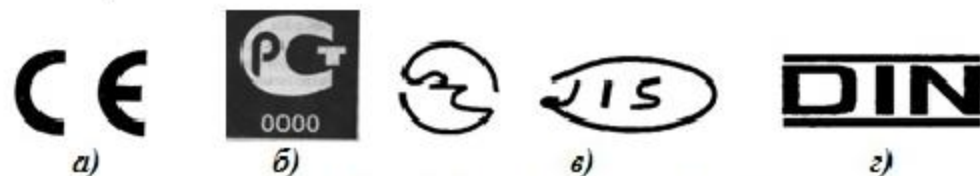
Рис. 3. Знаки соответствия: