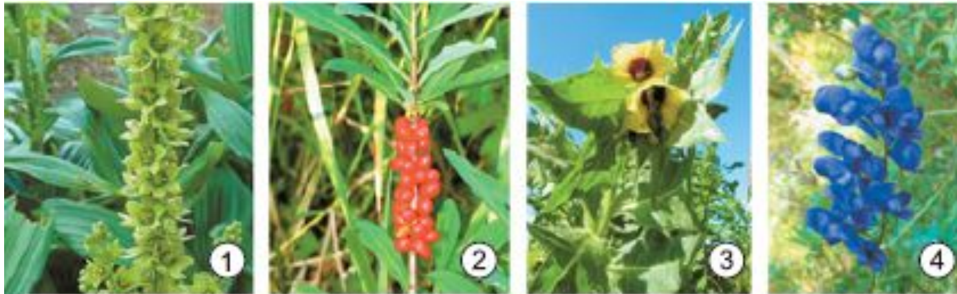
Отруйні рослини України: чемериця біла (1), вовча ягода (2), блекота чорна (3), аконіт (4)

Розрізняють отруйні рослини, які викликають ураження нервової системи: блекота, беладонна, крушина, молочай, дурман, індійські коноплі, снодійний мак, тютюн, чистотіл та інші. Є рослини, які вражають шлунково-кишковий тракт: вовче лико, турецькі коноплі, крушина, паслін, також молочай. Конвалія, наперстянка, чемериця погано діють на серце. Геліотроп, рожевий гірчак і хрестовик порушують функцію печінки. А шкіру вражають борщівник і кропива.