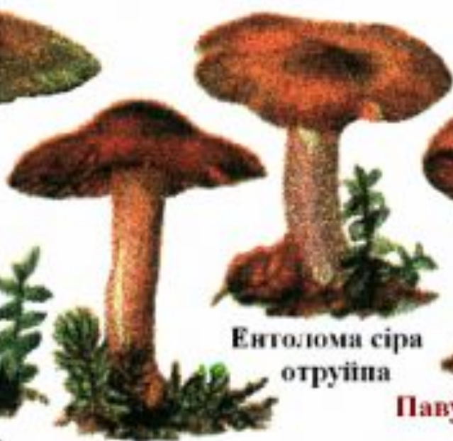
Ентолома сіра отруйна