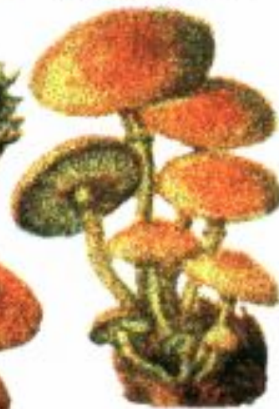
Опеньки несправжні сірчато-жовті