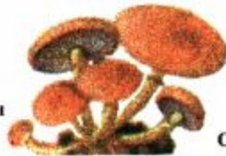
Опеньки несправжні, цеглово-червоні