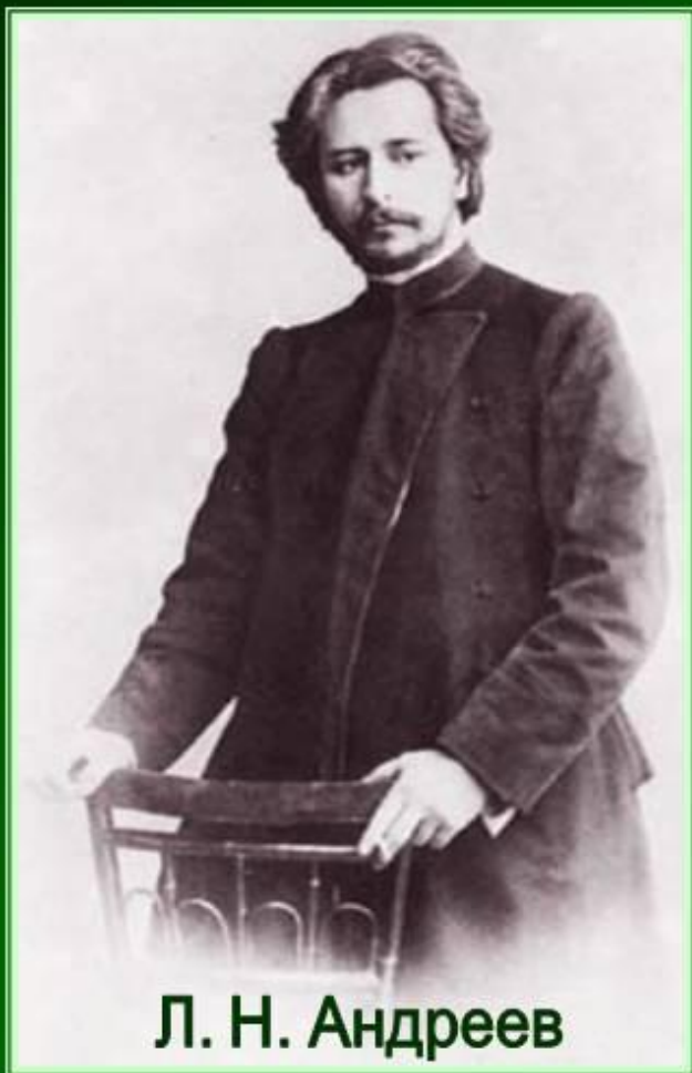
Л. Н. Андреев

Леонид Николаевич Андреев родился 9 (21) августа 1871 года в городе Орле