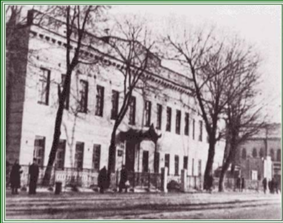
Орловская гимназия, в которой учился Л. Н. Андреев