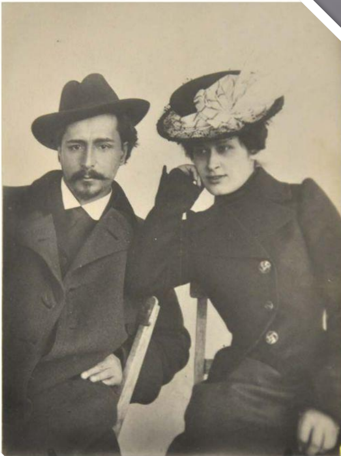
Леонид Андреев и Александра Велигорская