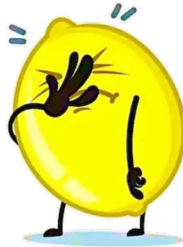
Мене урок розлютив