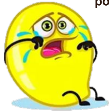
Було складно та нічого не