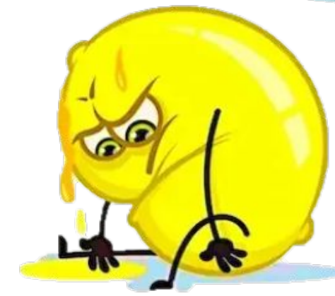
Я дуже втомився