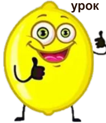
Більше сміху ніж навчання