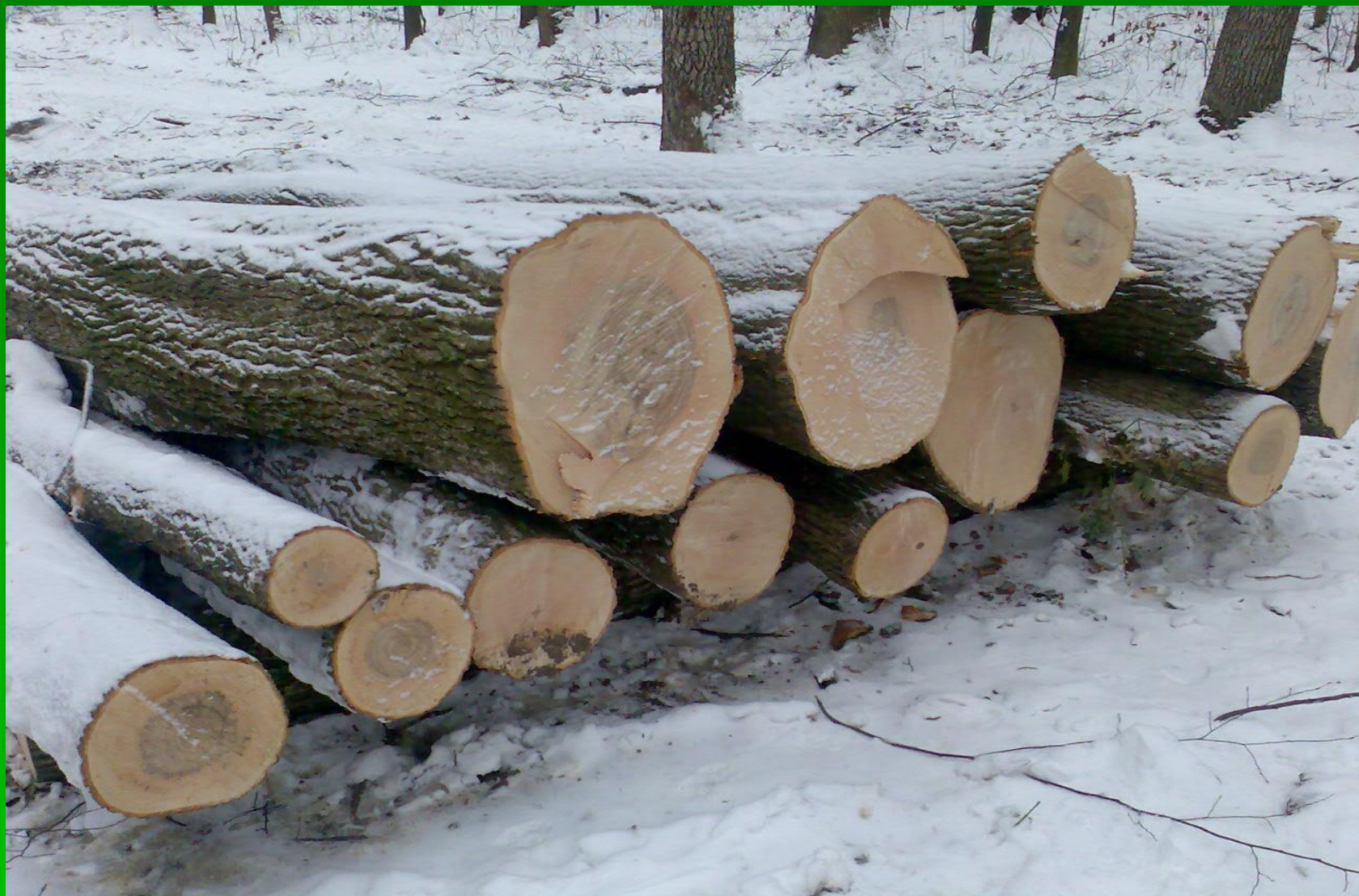
Рис. 2. Штабель ясена класу якості В та С на прохідній рубці Лисянського лісництва в кв. 47, вид. 2.2