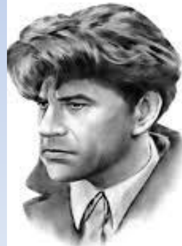
Григорій Тютюнник (1933—1982)

Написати твір-мініатюру на морально-етичну тему «Поспішайте робити добро», використавши українську народна мудрість «Три біди є у людини: смерть, старість і погані діти» як тезу, введіть до тексту речення з прямою мовою.