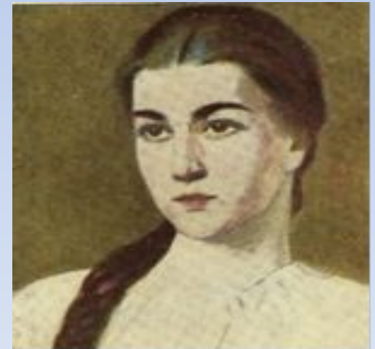
Портрет Марусі Чурай

Наведемо приклад внутрішнього монологу героїні із роману у віршах Ліни Костенко “Маруся Чурай”