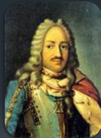
Лефорт Франц Яковлевич

Во время правления Петра I была организована дипломатическая миссия России в Западную Европу в 1697—1698 годах, которую возглавлял Лефорт и которая называлась « Великое посольство ».