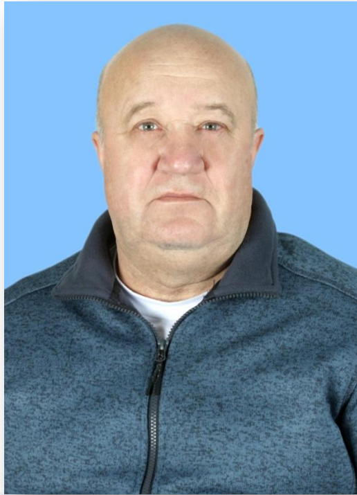
Юрий Григорьевич Нестеренко