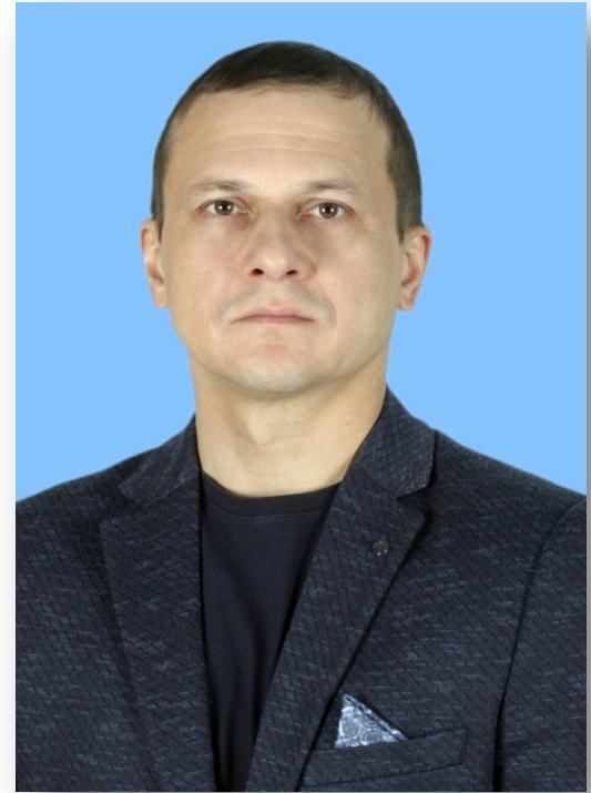
Дмитрий Иванович Чиж