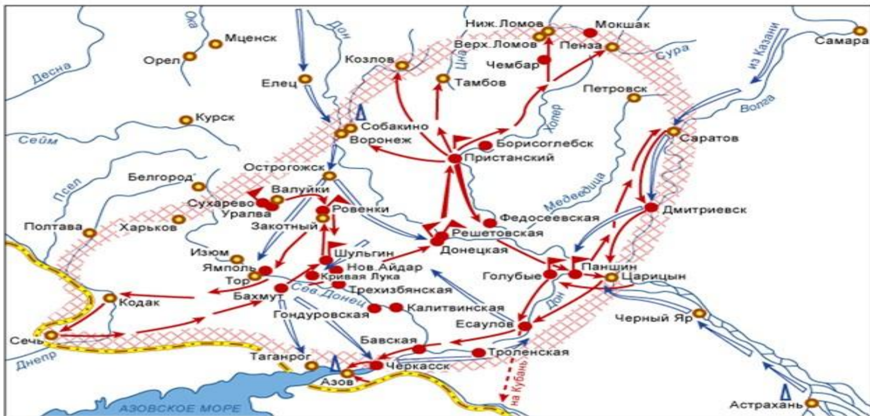
БУЛАВИНСКОЕ ВОССТАНИЕ 1707-1709 гг.