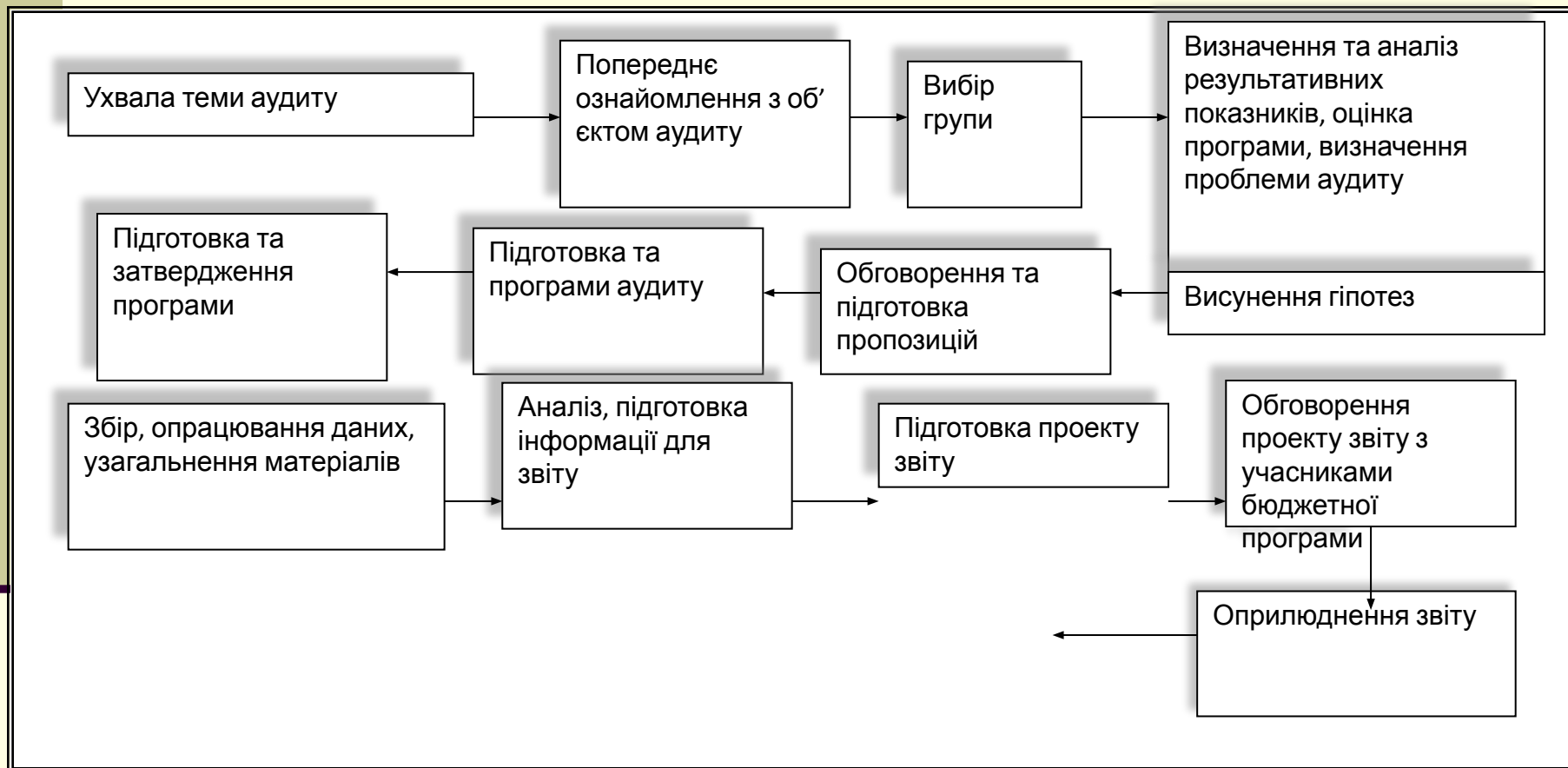
Схема організації та проведення аудиту ефективності виконання бюджетних програм