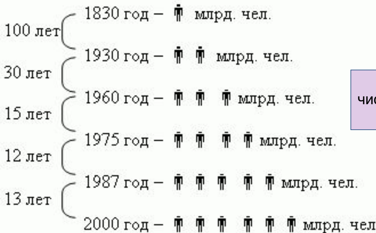
Рис.1. Увеличение численности на миллиард

Быстрый рост численности населения Земли