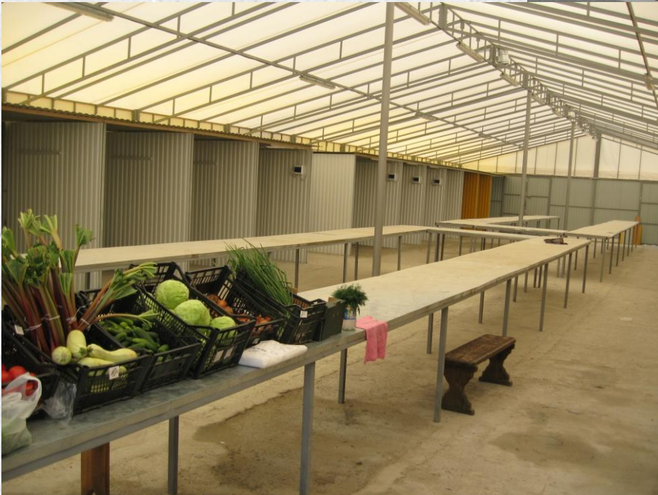
Критий павільйон для роздрібної торгівлі