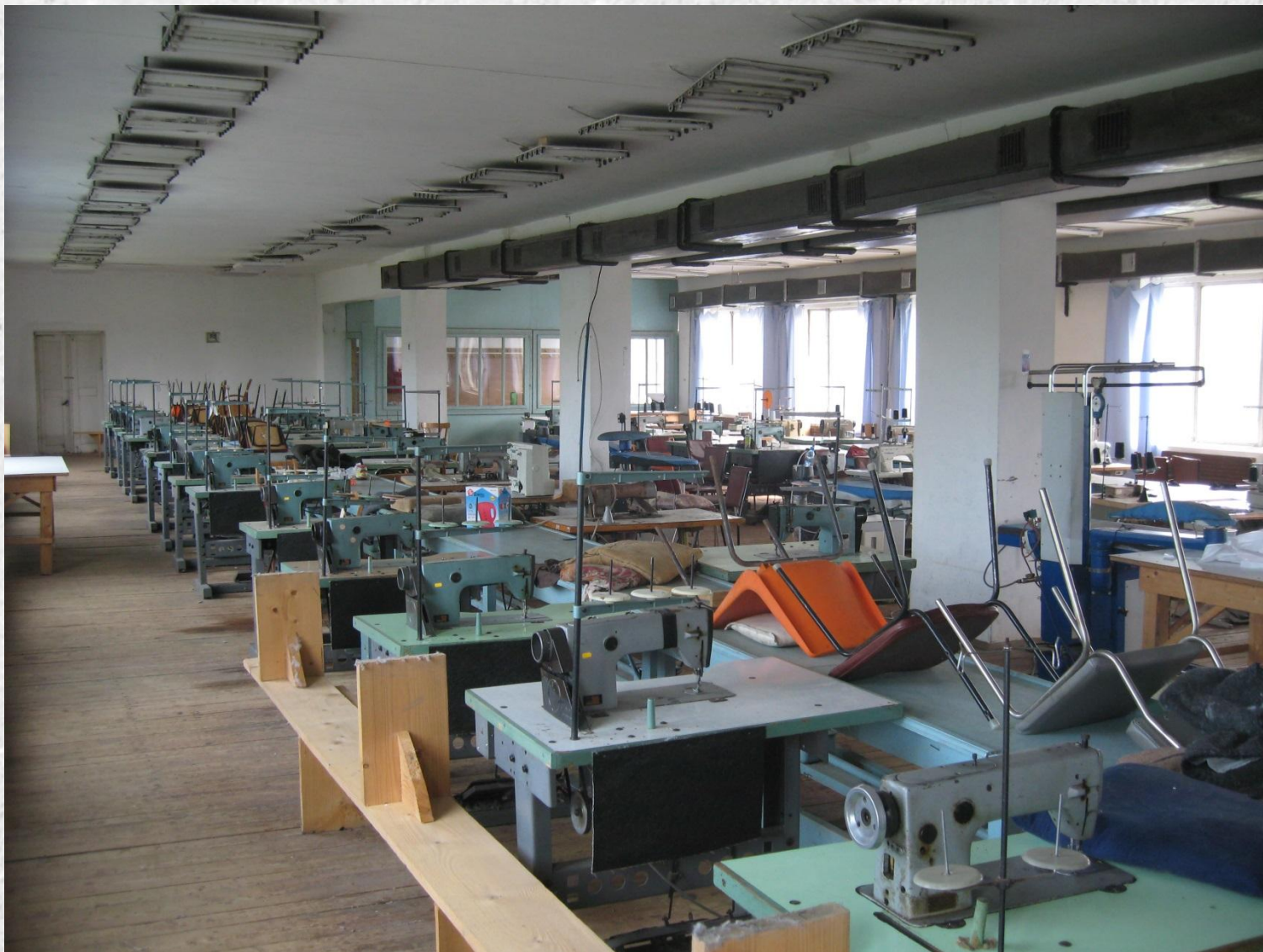
Швейний цех в с. Іламня