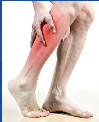
Судома м'язів литок