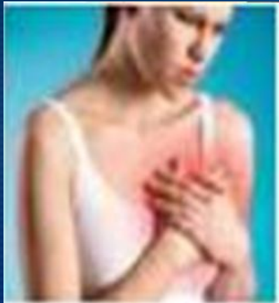
Судоми гладких м'язів за стенокардії