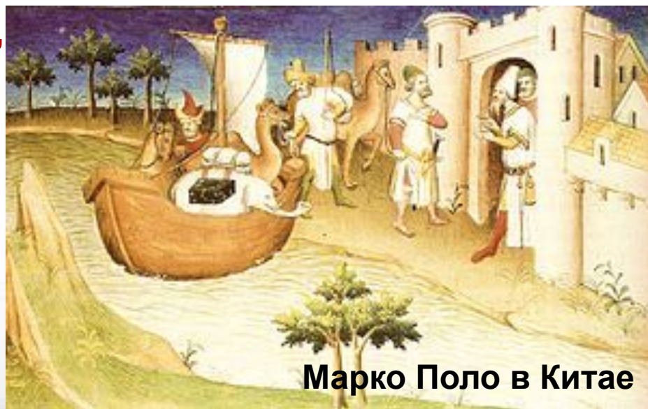
Марко Поло в Китае

В 1271 г. венецианский купец Марко Поло отправился в далекий и загадочный Китай. Путь в Китай лежал через многие страны. Вернувшись домой почти через четверть века, он не переставал восторгаться увиденными чудесами. В его речи то и дело слышалось: «Миллионе... миллионе». Слово «mille» («тысяча») было известно еще в Древнем Риме. Словечко «миллионе» , которым отважный путешественник называл тысячу тысяч , прочно пристало к Марко Поло. Современники прозвали его Марко Миллионе.