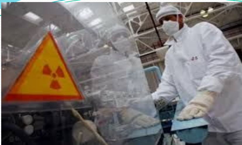
● Өндірістік авария