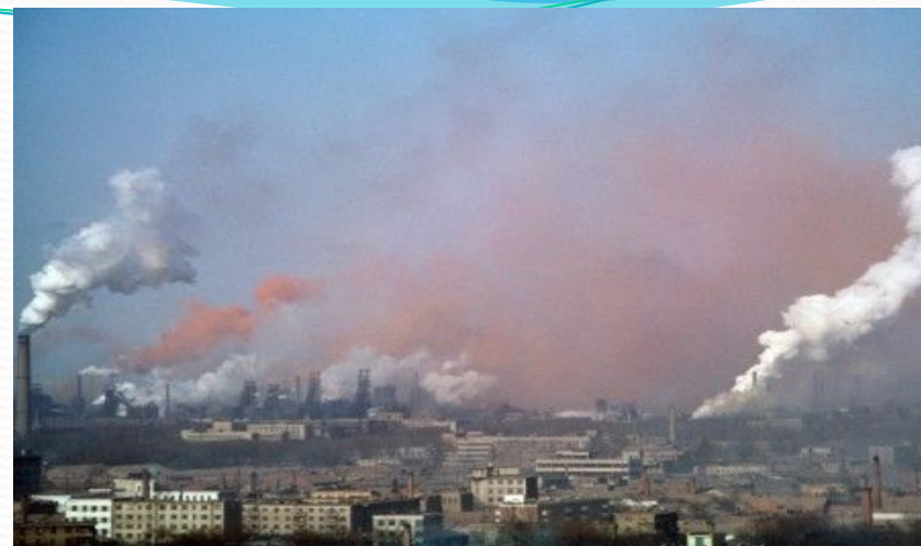
Қауіпті өндірістік фактор