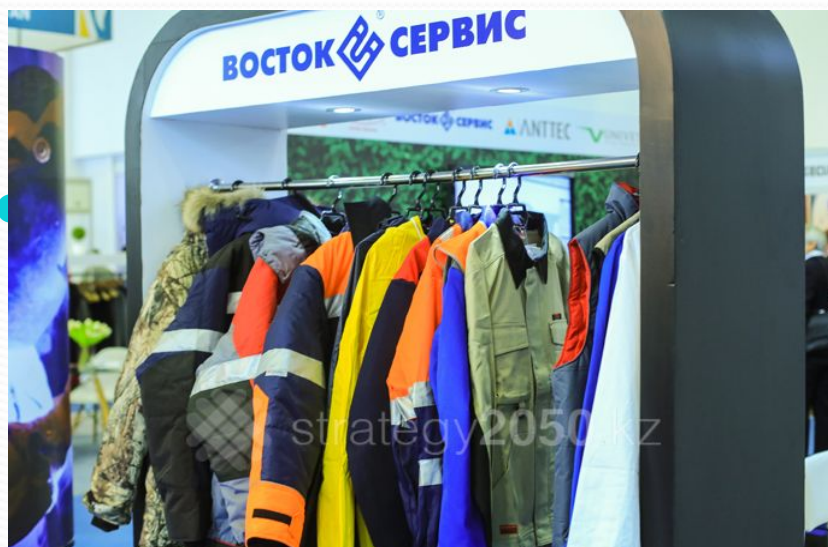
● Өнеркәсіптік қауіпсіздік