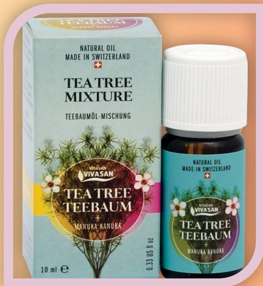
Э.м. Чайного дерева