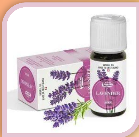
Э. м. Лаванда