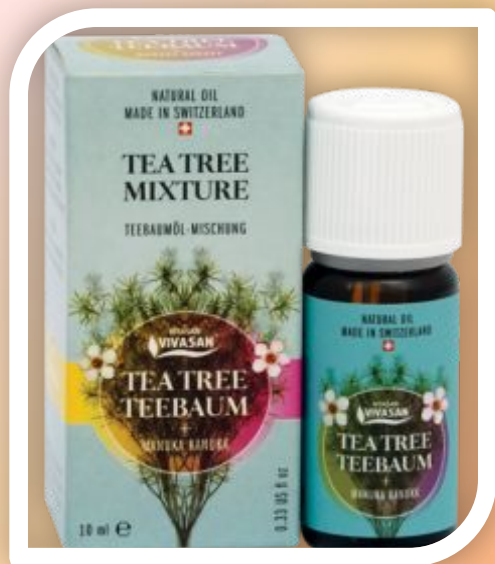
Масло Чайного дерева с манукой и канукой