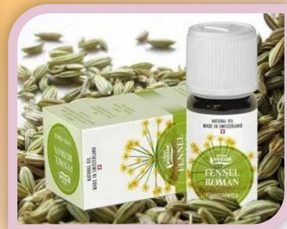
Э. м. Фенхель