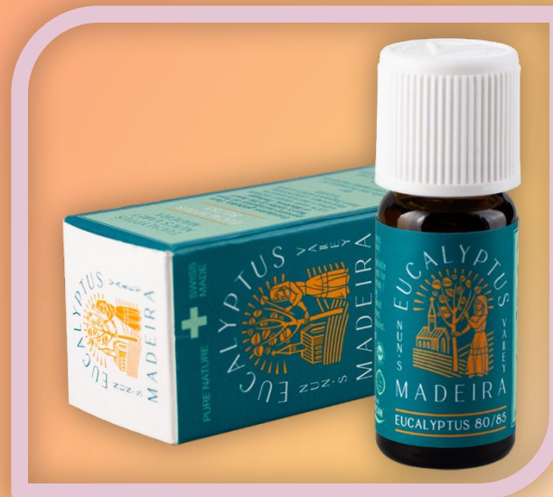
э.м. Эвкалипт «Мадейра»