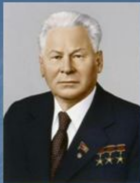
К.У.Черненко 1984 – 1985 гг.