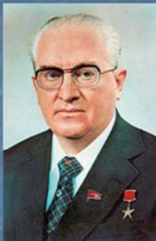
Ю.В.Андропов 1982 – 1984 гг.