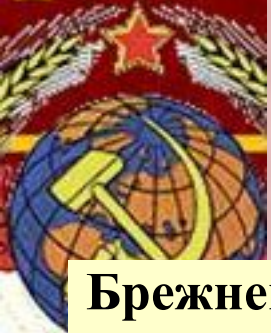
Л.И.Брежнев и его врач Е.И.Чазов.