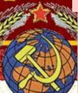
Фонтан «Дружба народов» на ВДНХ.