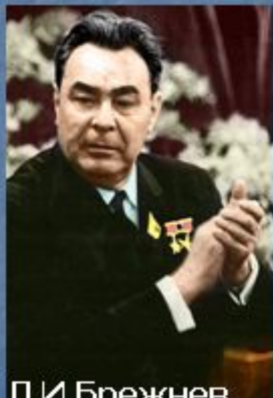
Л.И.Брежнев 1964 – 1982 гг.