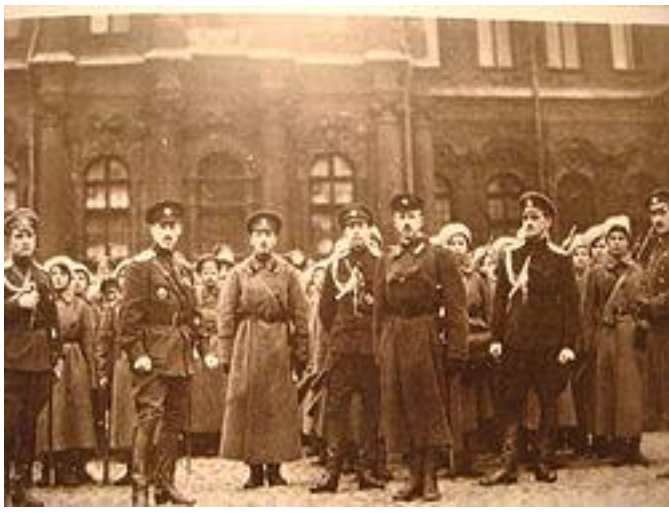
Женский ударный батальон на площади перед Зимним дворцом