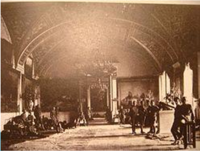
Юнкера в залах Зимнего дворца готовятся к обороне