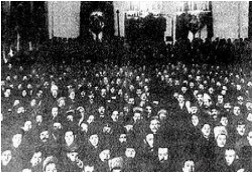
Заседание II Всероссийского съезда Советов в Смольном. 25 октября 1917 г.

Большинство на съезде составляли большевики и левые эсеры.