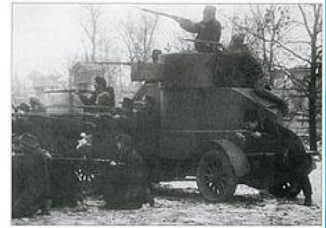
Броневик «Лейтенант Шмидт», захваченный красногвардейцами у юнкеров. Петроград, 25 октября 1917 г.