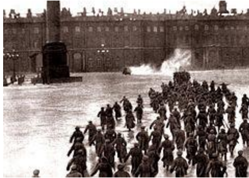
Штурм Зимнего дворца. Кадр из художественного фильма «Октябрь», 1927 г.