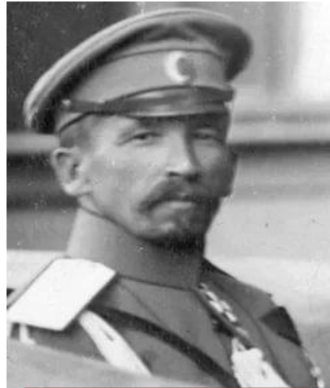
Лавр Георгиевич Корнилов Верховный главнокомандующий русской армией