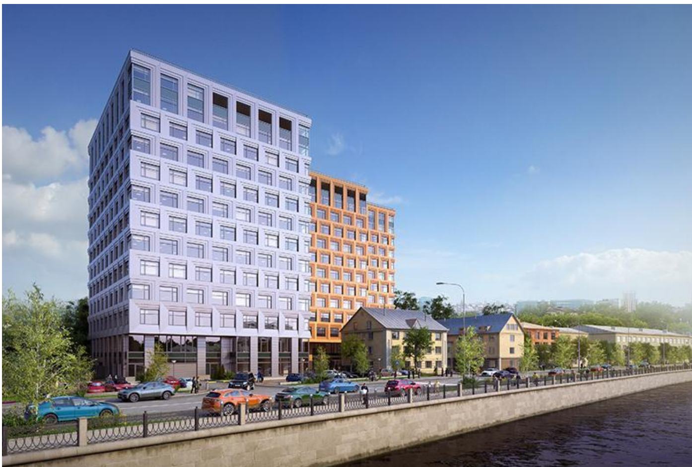
Бизнес-центр «Danilov Plaza» Москва, Новоданиловская набережная, дом 6