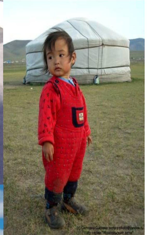
Из серии "Монгольские дети"