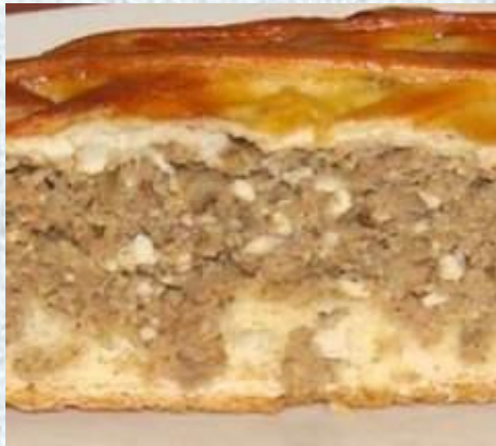
Начинка из мяса