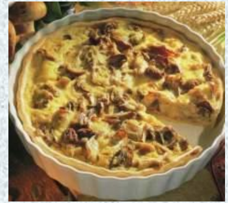
Начинка из грибов