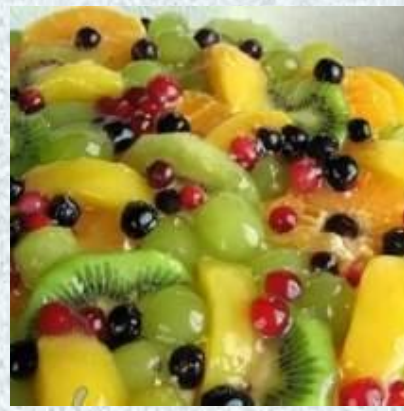
Начинка из фруктов