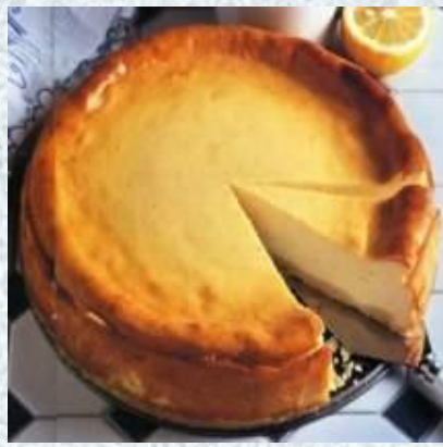
Начинка из творога