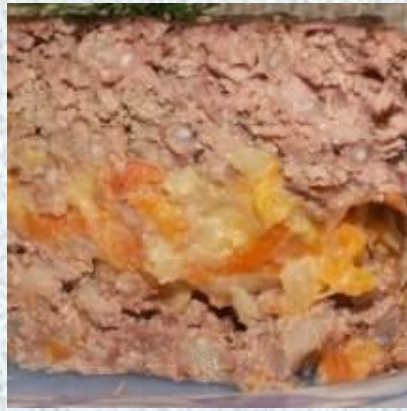
Начинка из субпродуктов