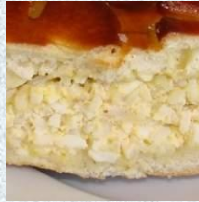
Начинка из круп, яиц