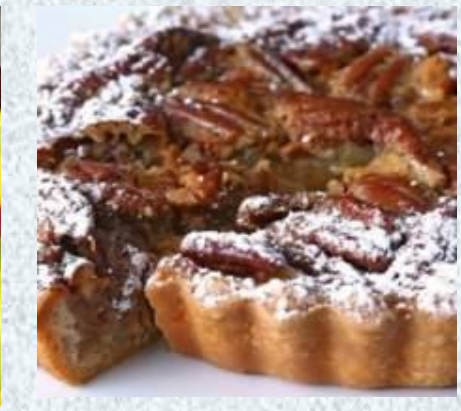
Начинка из орехов и мака