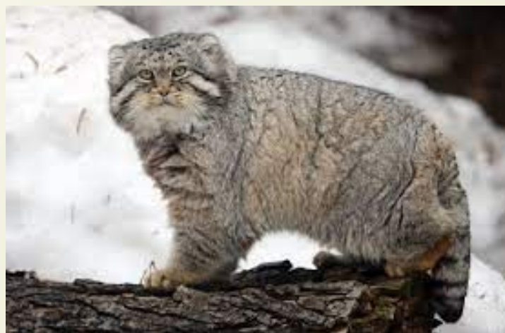
Манул (дикий кіт)