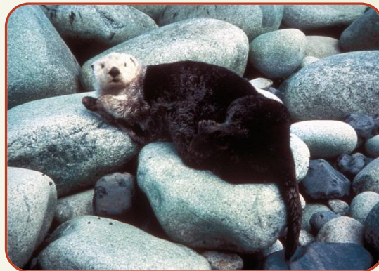
Калан або річкова видра