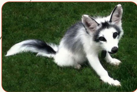
Канадська Мармурова лисиця