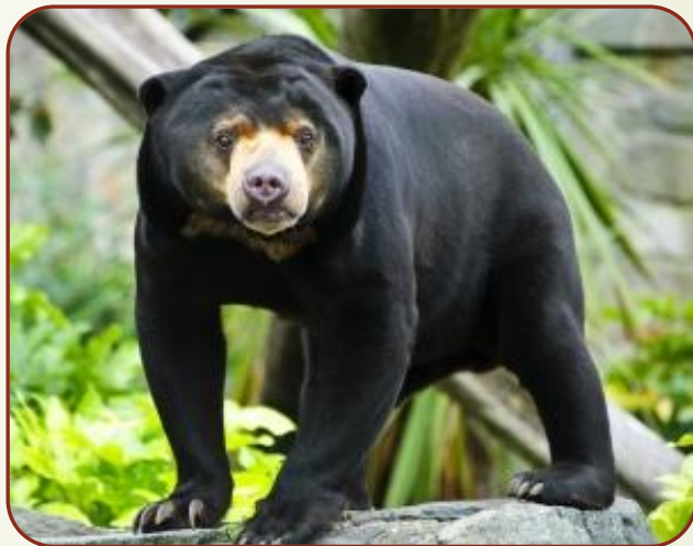
Біруанг Малайський ведмець