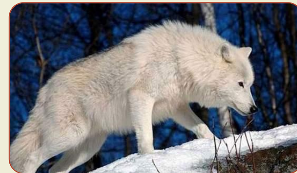
Мелвільський острівний вовк