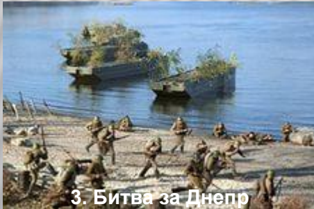
3. Битва за Днепр