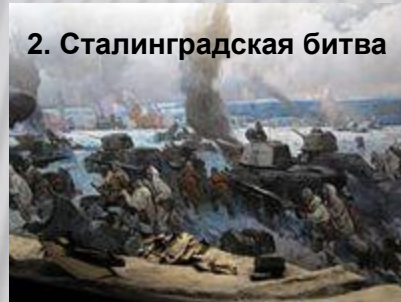
2. Сталинградская битва