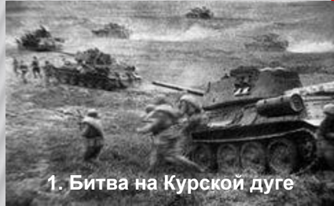
1. Битва на Курской дуге

Составьте хронологическую цепочку, ключевых сражений Великой Отечественной войны, начиная с самого отдалённого по времени события: