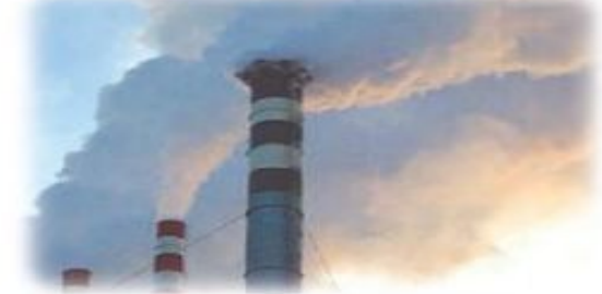
Техногенна аварія з викидом шкідливих речовин у повітря

Під час надзвичайних ситуацій людям, які опинилися на території, що постраждала, слід виконувати розпорядження рятувальних служб.