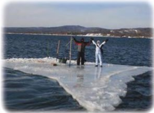
Рибалки на кризі

Екстремальні і надзвичайні ситуації загрожують здоров'ю і життю людей. В екстремальній ситуації небезпека загрожує окремії людині або групі людей.