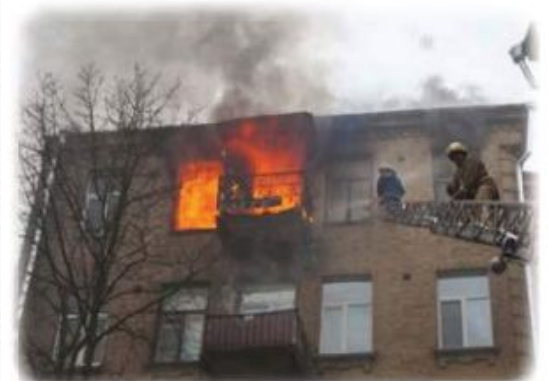
Пожежа в помешканні