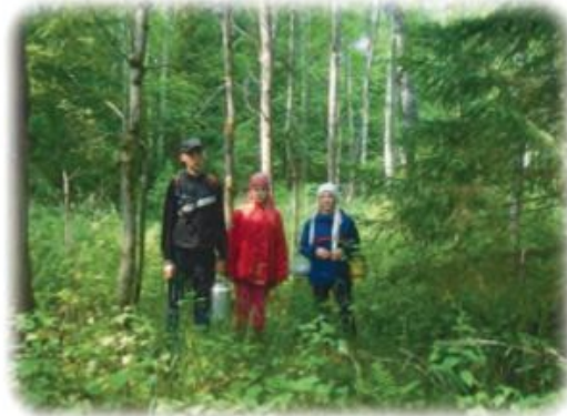
Підлітки заблукали в лісі