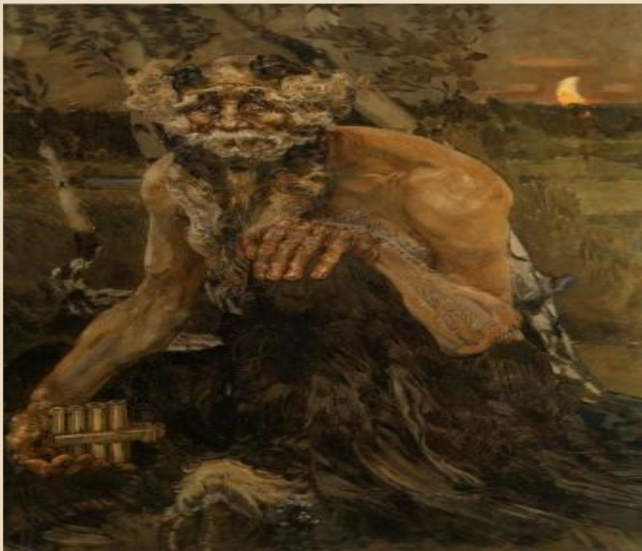
М.А. Врубель “ПАН”