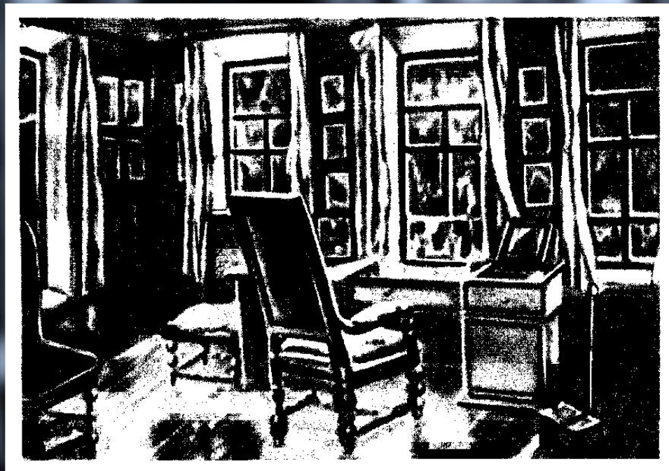
Кабинет А. Н. Островского в Щелькове, где он умер

Последние годы состояние здоровья А. Н. Островского тревожило его друзей и близких, но драматург продолжал работать до последнего дня своей жизни.. 2 июня 1886 года в Щелькове он скончался