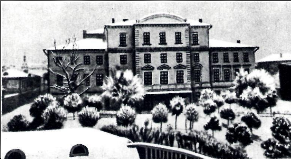
Первая московская гимназия, где учился А. Н. Островский.

Еще в гимназии он увлекается литературой, и первые опыты его литературного творчества относятся к гимназическому времени.