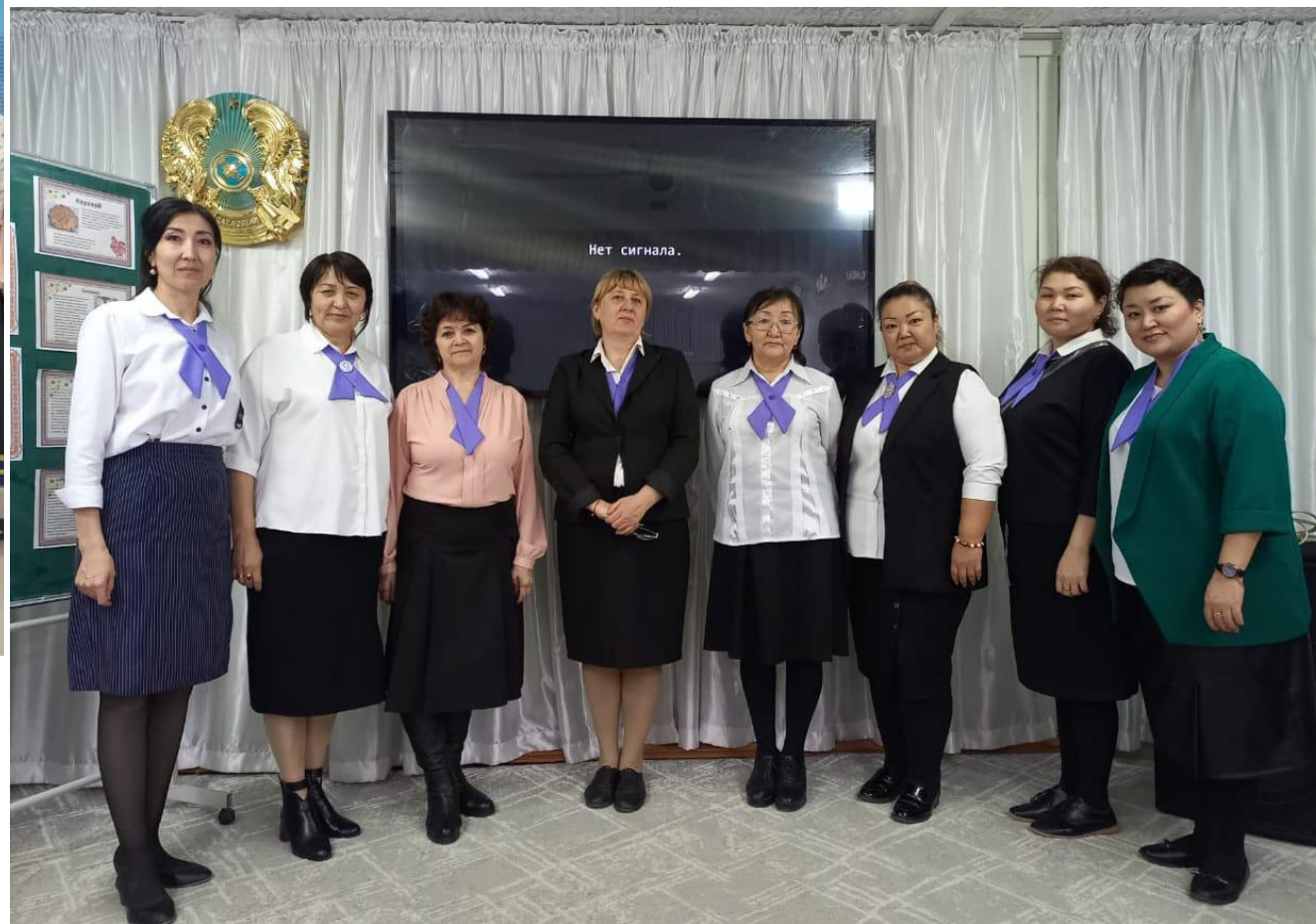
МО учителей русского языка и литературы